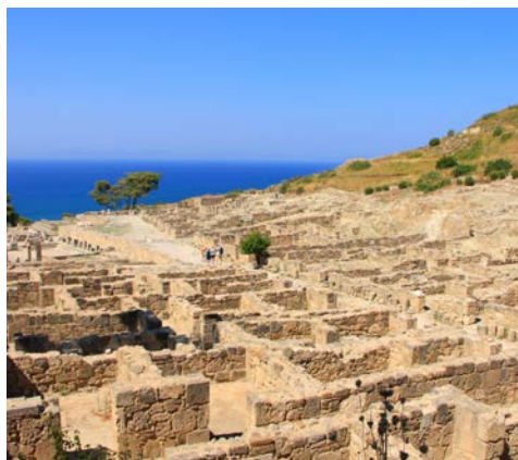
Ausgrabungen von Kamiros

Heute geht es für Sie in das am Stadtrand von Rhodos auf einem 267 Meter hohen Hügel gelegene Filerimos. Hoch oben befinden sich das byzantinische Kloster von Filerimos und die Überreste des Tempels Athena Polias, welcher einst zur antiken Stadt von Ialysos gehörte. Von hier aus genießt man einen fantastischen Ausblick auf das Ägäische Meer. Danach geht es in das Tal der Schmetterlinge, welches nach den vielen Faltern benannt wurde, die im Juli zu Millionen die Gegend bevölkern. Dort unternehmen Sie eine kleine Wanderung durch die beeindruckende Schlucht. Abschließend besuchen Sie die antike Stadt Kamiros, wo Sie Relikte aus dem 6. Jahrhundert v. Chr. besichtigen können. Abendessen im Hotel.