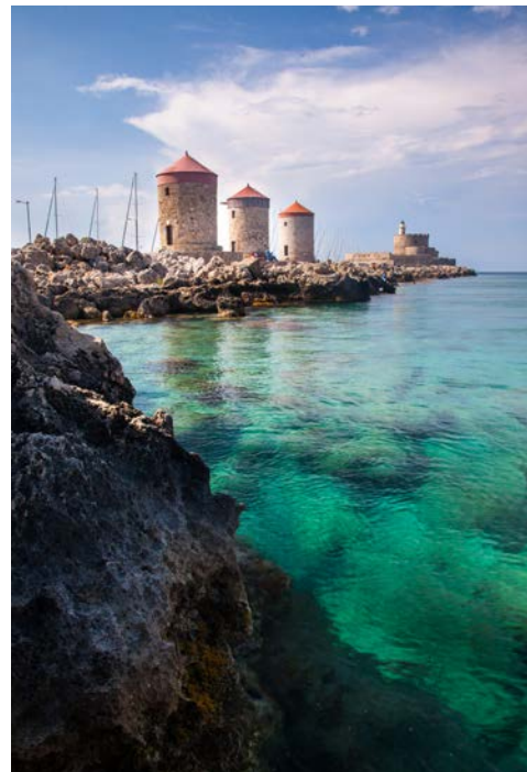
Drei Mühlen auf der Mole am Hafen von Rhodos Stadt

Nach dem Frühstück erfolgen, je nach Rückflugzeit, der Transfer zum Flughafen und der Rückflug nach Bremen. Anschließend Taxi-Service (falls gebucht) nach Hause.