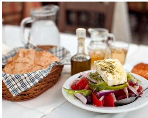
Griechische Küche - einfach lecker!