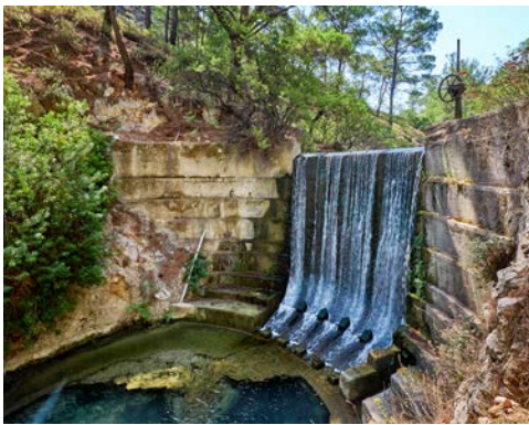
Epta Piges – Tal der sieben Quellen

sieben Wasserquellen und des Profitis Ilias-Pinienwaldes. In Phountoukli besichtigen Sie die byzantinische Kirche mit ihren schönen Wandmalereien und in Monolithos sehen Sie die mächtige Johanniterfestung spektakulär auf einer Fels Spitze gelegen. Mittagspause machen Sie im Weindorf Embona, wo Sie ein landestypisches Mittagessen mit Meze und einem Glas Ouzo in einer typischen Taverne genießen. Abendessen im Hotel.