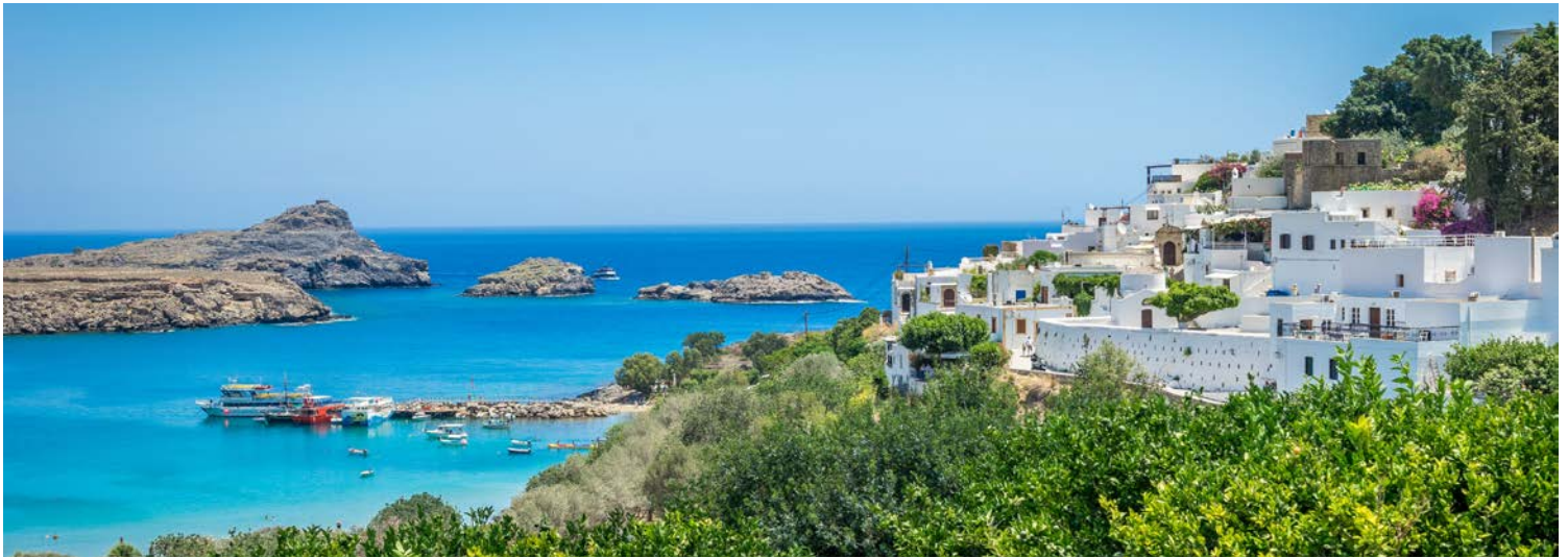
Blick auf die weiße Stadt Lindos