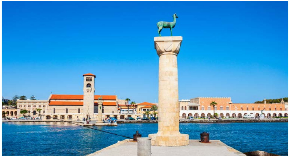
Hier soll der Koloss von Rhodos gestanden haben – eines der sieben Weltwunder

Liebe Leser, wer kennt nicht den „Koloss von Rhodos“, eines der sieben Weltwunder des Altertums. Er schmückte die Hafeneinfahrt der Hauptstadt Rhodos und war ein Symbol für die Macht der Insel in der Antike und ihrer Hochkultur. Heute ist Rhodos eine beliebte Urlaubsinsel und bietet neben strahlendem Sonnenschein auch kulturelle Höhepunkte und landschaftliche Schönheiten. Lernen Sie diese bezaubernde Insel, ihre Geschichte und ihre Menschen während der zubuchbaren Ausflüge näher kennen. Genießen Sie ein paar unvergessliche Tage im beliebten 4-Sterne Hotel Blue Horizon und lassen Sie sich von der griechischen Gastfreundschaft verwöhnen.