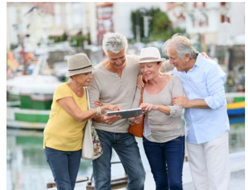
Unterwegs auf Entdeckungstour

Der heutige Tag steht Ihnen zur freien Verfügung. Entspannen Sie in der Hotelanlage oder am Strand. Für Tipps zu eigenen Unternehmungen auf eigene Faust, steht Ihnen Ihre Reiseleitung vor Ort gerne zur Verfügung.