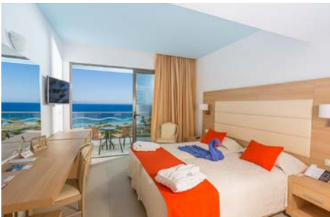
Ihr Hotel (oben), Zimmerbeispiel (unten)