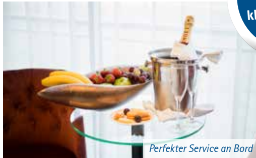
Perfekter Service an Bord