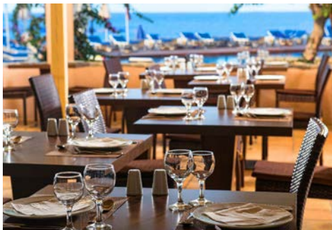
Restaurant des Hotels