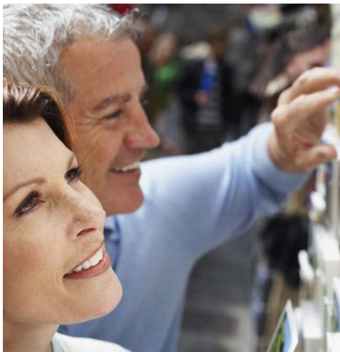
Vielleicht noch ein Souvenir besorgen?