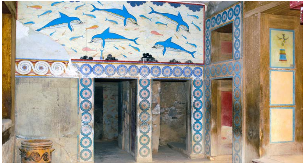
Gut erhaltene Wandmalerei in Knossos

Liebe Leser, die fünftgrößte Mittelmeerinsel zeichnet sich durch ein besonders mildes Klima mit über 300 Sonnentagen im Jahr aus. In ihrem komfortablen Strandhotel können Sie somit die freien Tage optimal genießen und sich zudem von der kretischen Gastfreundschaft verwöhnen lassen. Neben einer landschaftlichen Vielfalt wird die Insel natürlich durch ihre mehrere tausend Jahre alte Geschichte geprägt, die Ihnen auf Schritt und Tritt begegnet. Sehen Sie den weltbekannten Tempel von Knossos, Bestandteil der berühmten Sage des Minotaurus oder besuchen Sie die Lassithi-Hochebene, Geburtsort der Götter. Eine erlebnisreiche Woche steht Ihnen bevor!