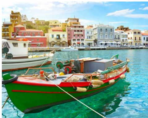
Agios Nikolaos – malerisch gelegen

Der Tag steht Ihnen zur freien Verfügung. Vielleicht verbringen Sie einen entspannten Tag am Hotelpool. Optional können Sie an einem Tagesausflug teilnehmen, der Sie in den Westen Kretas führt. Sie besuchen die landestypischen Dörfer Anogia und Axos. Dort nehmen Sie an einem Kochkurs für die traditionelle kretische Küche teil. Anschließend können Sie sich beim Mittagessen von ihrer eigenen Kochkunst überzeugen. Danach besuchen Sie die familiengeführte Weinkellerei Alexakis. Nach einer Führung können Sie bei einer Weinprobe die Qualität der Weine genießen.