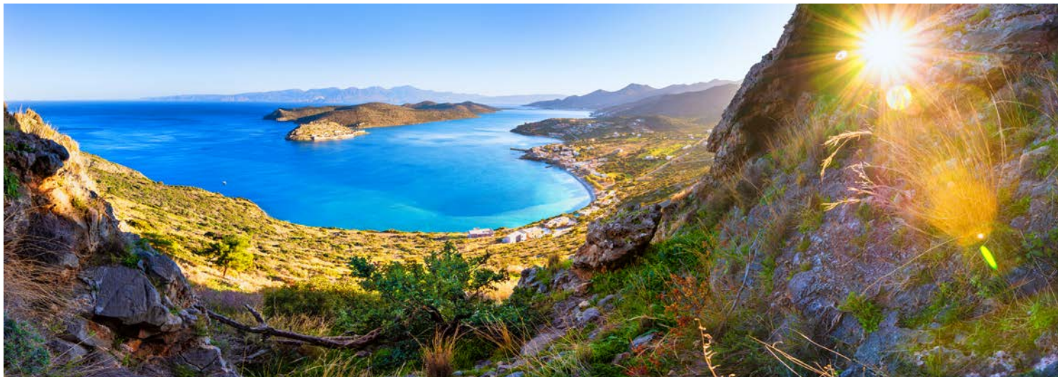
Panorama-Blick im Golf von Elounda mit Aussicht auf die Insel Spinalonga