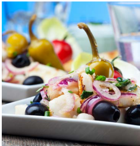
Genießen Sie die griechischen Spezialitäten

Heute können Sie die Annehmlichkeiten Ihrer komfortablen Hotelanlage genießen oder die Umgebung auf eigene Faust erkunden. Selbstverständlich gibt Ihnen die Reiseleitung auch gerne Tipps, um diesen Tag abwechslungsreich zu gestalten.