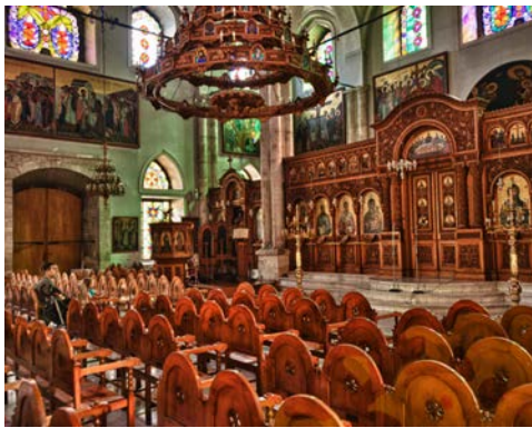
Titus Kirche Heraklion

Zu den Höhepunkten jeder Kretareise zählt der Besuch von Knossos. Der Palast war einst Zentrum der minoischen Kultur, die vor 4.000 Jahren entstand und als älteste Hochkultur Europas angesehen wird. Begegnen Sie dieser fernen Epoche bei einem geführten Rundgang durch die teilweise rekonstruierte Palastanlage mit ihrer faszinierenden Architektur. Nur wenige Kilometer entfernt liegt die heutige Inselmetropole Heraklion. Der Aufenthalt dort gibt auch Gelegenheit zu Einkäufen und zum Kennenlernen der Hauptstadt der Insel. Weiter führt Sie die Route nach Peza, wo mehrere Wein- und Olivengenosenschaften Kretas zu Hause sind. Dort haben Sie Gelegenheit eine Weinkellerei zu besuchen und sich an einer Weinprobe zu erfreuen, bevor es wieder zurück zum Hotel geht.