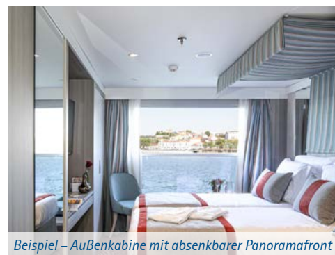
Beispiel – Außenkabine mit absenkbarer Panoramafont