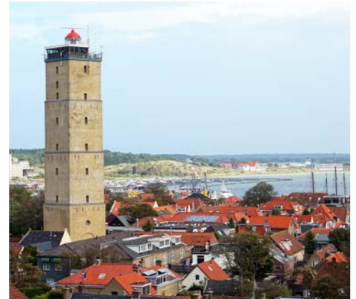
Der Leuchtturm „Brandaris“ in West-Terschelling

Erkunden Sie heute auf einer Rad-Rundtour Texel, die größte westfriesische Insel, mit abwechslungsreicher Landschaft und malerischen Dörfern. Tipp: Die gut ausgeschilderte Thijsseroute (ca. 40 km) mit Besuch der Seehundaufzuchtstation EcoMare.