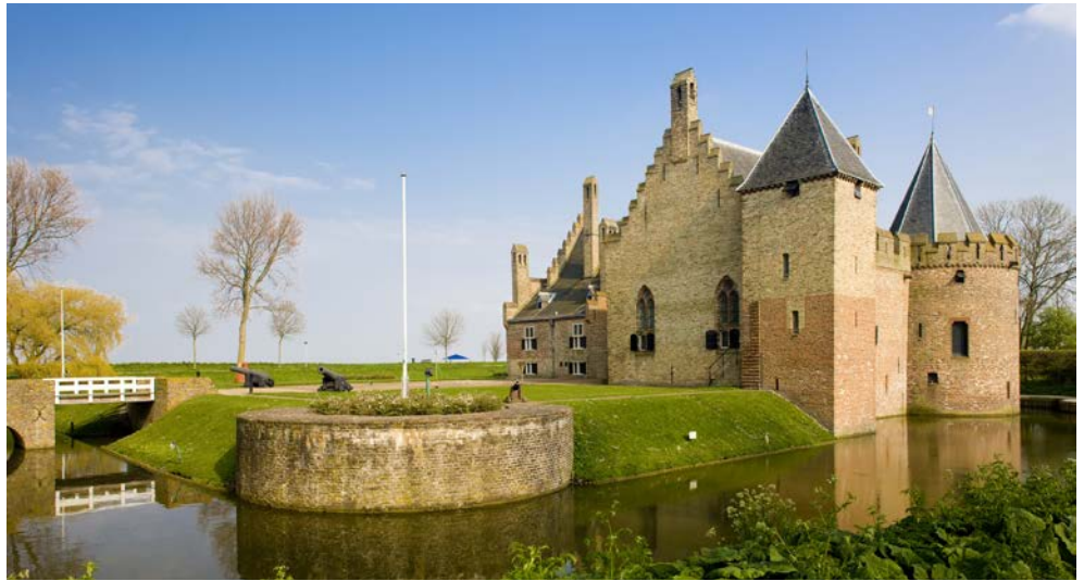
Traumhaft schön: Medemblik

Wind und Salz auf der Haut und ein Gefühl von Freiheit! Segelreisen sind etwas Besonderes. Es ist ein bisschen so, als ob man als Seefahrer-Pionier die Meere erkundet... Erleben Sie hautnah auf der WAPEN FAN FRYSLAN das IJsselmeer und das Wattenmeer. Natur und Elemente pur: Meer, Wind und Sonne. Vor der Nordseeküste erstreckt sich das Watt, ein Naturgebiet, das in der ganzen Welt einzigartig ist. Auf dem Festland der Provinzen Nord-Holland und Friesland erwarten Sie weite Landschaften, beschauliche Orte und malerische Fischerstädtchen. Freuen Sie sich auf eine steife Brise in den Segeln und einen endlosen Blick aufs Wasser, auf Dünen und trocken gefallene Sandbänke. Wenn Sie Lust haben, können Sie an Deck mit anpacken – erforderlich ist es nicht. Auch Segelerfahrung ist nicht nötig. Worauf warten Sie noch? Leinen los!