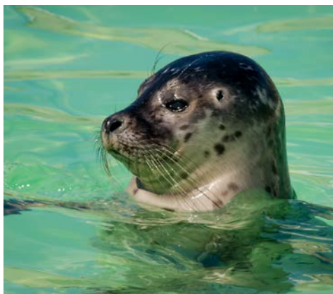
Besuchen Sie die Seehundaufzuchtstation Eco-Mare

Nach dem Frühstück erfolgt die Ausschiffung bis 9.30 Uhr und Ihre Heimreise wie gebucht.