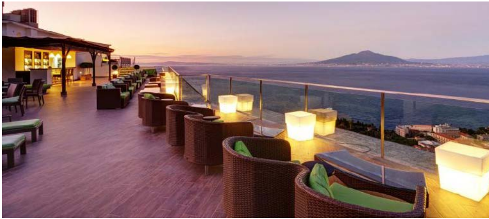
Herrlicher Ausblick von der Dachterrasse