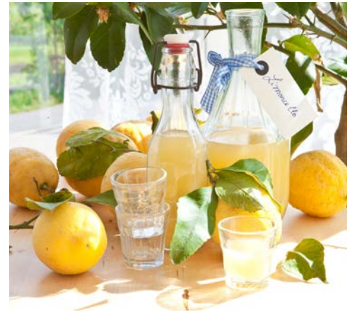
Limoncello – Schon probiert?

Reiseveranstalter: Hanseat Reisen GmbH, Langenstraße 20, 28195 Bremen.