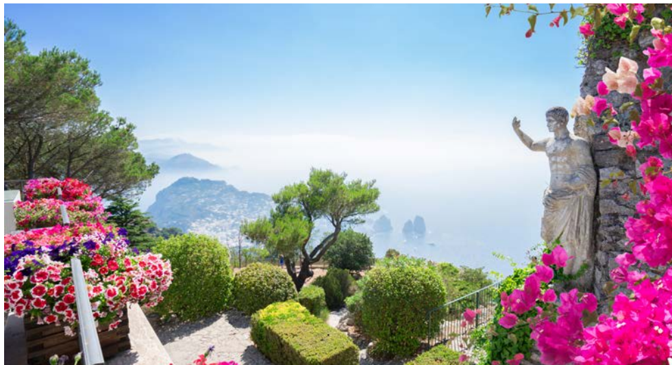
Capri – traumhafte Aussichten von den Augustusgärten

Seit Jahrhunderten inspiriert die Schönheit des Golfs von Neapel Literaten und Musiker aus ganz Europa. Die einzigartige Kulturlandschaft besticht durch prachtvolle Blütengärten, bizarre Felsformationen und ein azurblaues Meer. Verschlungene Küstenstraßen führen durch Orangen- und Zitronenhaine zu Stätten antiker Geschichte. Kampanische Bauern bewirtschaften ihre Gärten und Höfe in der zerklüfteten Küstenlandschaft seit Generationen. Ob Mozzarella oder Limoncello, hier kommen die Gaben der Natur direkt auf den Tisch. Über all dem thront der Vesuv, sagenhafter Mythos und Ehrfurcht erregende Naturgewalt. Idealer Ausgangspunkt, um diesen reizvollen Landstrich Kampaniens intensiv zu erkunden, ist Sorrent. Ein malerischer Ort, der imposant auf einem Felsplateau liegt. Ganz in der Nähe gründeten die Römer die mondäne antike Stadt Pompeji, deren durch Asche konservierte Architektur die Besucher noch heute in die untergegangene Kultur eintauchen lässt. Spätere Könige, Päpste und Fürsten prägten mit dem Bau gotischer Kirchen und barocker Prachtbauten die Altstadt von Neapel. In kleinen Bergdörfern überdauerten zudem die Bauwerke der Normannen und Mauren die Jahrhunderte. Und auf der wohl schönsten Insel des Tyrrhenischen Meeres, auf Capri, finden sich bis heute Spuren früher Bewunderer der einzigartigen Natur. Hier verbrachten im 19. Jahrhundert sowohl der schwedische Schriftsteller Axel Munthe als auch der deutsche Industrielle Friedrich Alfred Krupp ihre wohl schönsten Lebensjahre.