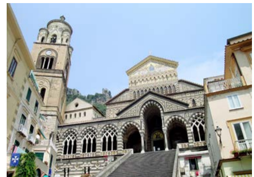
Dom von Amalfi

Flugplan-, Hotel- und Programmänderungen vorbehalten. An- und Abreisetag dienen ausschließlich der Erbringung der vertraglichen Beförderungsleistungen. Je nach Fluggesellschaft und Flugdauer werden Bordverpflegung und Getränke nur gegen Bezahlung angeboten. Stand 08/22 – alle Angaben ohne Gewähr.