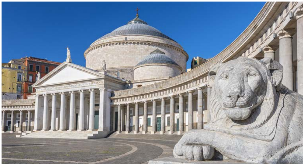
Neapel – Piazza Plebiscito