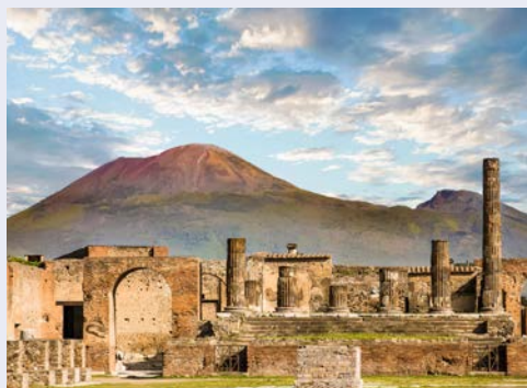
Pompeji und Vesuv – ein Muss für jeden!

Per Kleinbus geht es nach Sorrent und Sie unternehmen einen geführten Stadtpaziergang zu den wichtigsten Sehenswürdigkeiten des charmanten