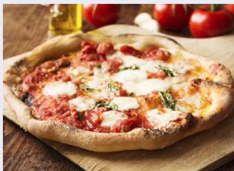
Ein Klassiker – Pizza Napoletana