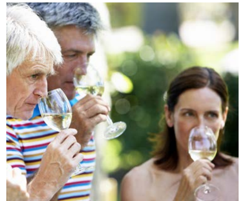
Freuen Sie sich auf eine Weinprobe im Muscadet

Frühstück an Bord. Der heutige Vormittag steht ganz im Zeichen der Stadt Nantes, der ehemaligen Residenz der bretonischen Herzöge. Heute ist sie Hauptstadt der Region Pays de la Loire mit Universitäts- und Bischofssitz. War in Nantes einst die Loire der wichtigste Handelsweg, so wurde ihre Bedeutung durch die Eisenbahn abgelöst und die Wasserwege überbaut. Dennoch zeugen noch heute die Häuser von Reedern und Kaufleuten vom damaligen Wohlstand durch den Handel mit Zucker und Sklaven. Lernen Sie auf der Stadtführung die Schönheiten und wichtigsten Sehenswürdigkeiten von Nantes kennen. Mittagessen an Bord. Am Nachmittag starten Sie mit dem Bus zu einem Ausflug auf der „Route du Muscadet“. Der im Weinbaugebiet Muscadet angebaute gleichnamige Weißwein wird aus der Rebsorte Melon de Bourgogne erzeugt und ist bekannt für seinen frischen und fruchtigen Geschmack.