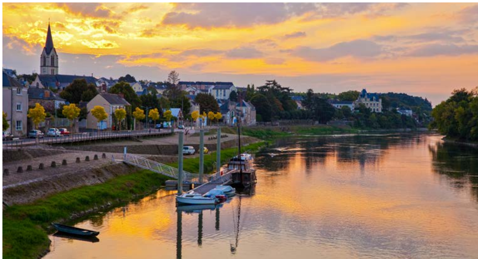
Impressionen der Loire bei Chalonnnes

In einem Château werden Sie nach einer Führung auch Gelegenheit haben, den leckeren Wein zu probieren. Pünktlich zum Abendessen kommen Sie zurück an Bord und die LOIRE PRINCESSE setzt Ihre Fahrt fort.