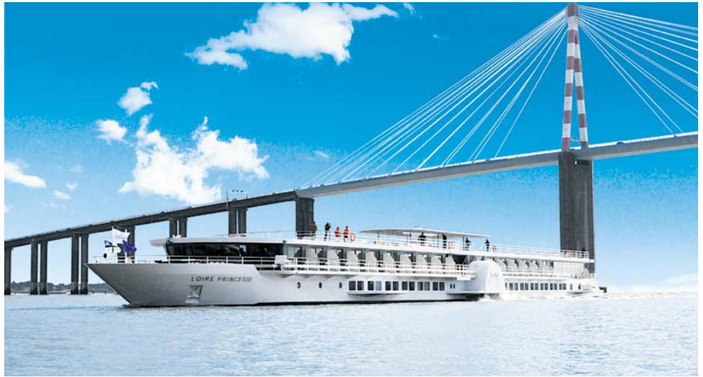
Ihr Schiff – LOIRE PRINCESSE

Die Loire ist mit mehr als 1.000 km der längste Fluss Frankreichs. Sie entspringt im Zentralmassiv und durchfließt das Land bis Orléans in nördlicher, dann in westlicher Richtung bis zum Atlantik bei Saint-Nazaire. Hunderte von einzigartigen Schlössern und Burgen, teils mit ausgedehnten Gartenanlagen, teils inmitten von Wäldern oder Weinbergen, säumen ihren Lauf. Diese außergewöhnliche Kulturlandschaft zeugt von einer zweitausendjährigen Entwicklung zwischen Mensch und Umwelt und wurde im Jahr 2000 zum UNESCO-Welterbe ernannt. Auf dieser Reise lernen Sie viele der beachtlichen Sehenswürdigkeiten rechts und links der Ufer kennen. Sämtliche Ausflüge sind inklusive – und das Beste, Ihr „Zuhause“ ist immer mit dabei. Die LOIRE PRINCESSE geleitet Sie bequem von Hafen zu Hafen.