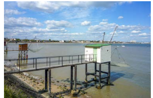
Impressionen in St. Nazaire

Flug nach Nantes. Hier werden Sie bereits von der LOIRE PRINCESSE zur Einschiffung erwartet. Nach dem Kabinenbezug lernen Sie bei einem Begrüßungsgetränk die Mannschaft kennen und nehmen dann im Schiffsrestaurant Platz zu Ihrem ersten Abendessen an Bord. Währenddessen leuchtet die LOIRE PRINCESSE den Anker und nimmt Kurs auf St. Nazaire.