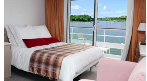
Salon (oben), Kabinenbeispiel Oberdeck (unten)