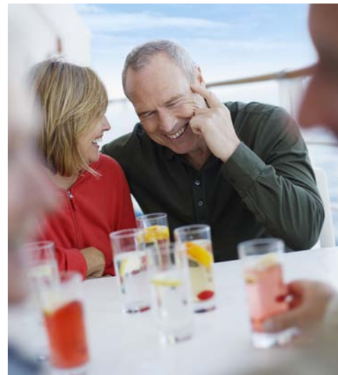
Genießen Sie Ihre Zeit an Bord

Sehr früh am Morgen startet die LOIRE PRINCESSE zur letzten Fahrtetappe zurück nach Nantes. Hier heißt es nach dem Frühstück dann auch Abschied nehmen. Es erfolgen der Transfer zum Flughafen und der Rückflug nach Deutschland.