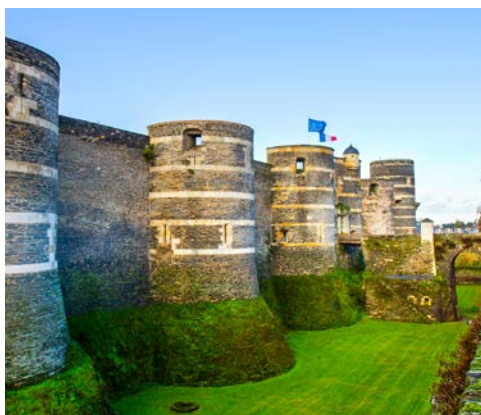
Wehrtürme des Schlosses von Angers

Genießen Sie nach Ihrem Frühstück an Bord die wechselnden Landschaftsbilder durch die Panoramafenster im Salon Ihres Schiffes oder, wenn es das Wetter erlaubt, von einem der bequemen Liegestühle auf dem Sonnendeck aus. Während des Mittagessens macht die LOIRE PRINCESSE die Leinen in Chalonnnes fest. Ihr Reisebus erwartet Sie bereits zu einem Ausflug nach Angers. Die ehemalige Hauptstadt des Anjou besitzt eine lange Geschichte, die bis in die Steinzeit reicht, und die Altstadt gehört zum Weltkulturerbe der UNESCO. Besonders sehenswert ist das Château d'Angers, das Sie im Rahmen einer Führung besuchen werden. Das Schloss ist Teil der Stadtmauer und gleicht mit seinen 17 Türmen und der Wehrmauer von außen eher einer Festung. Im Inneren jedoch erwarten den Besucher elegante Gebäude und Gartenanlagen. Der Höhepunkt Ihres Schlossbesuches ist sicherlich die Besichtigung des ältesten erhaltenen Teppichzyklus Frankreichs, „die Apokalypse von Angers“. Der in der großen Galerie gezeigte 100 m lange und fast 5 m breite Bildteppich zeigt in beeindruckender Größe den Weltuntergang. Die LOIRE PRINCESSE ist zwischenzeitlich nach Bouchemaine gefahren, wo Sie zum Abendessen zurück an Bord kommen.