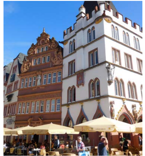
Bummeln Sie durch Trier!

Nach dem Frühstück erfolgt heute die Heimreise wie ausgeschrieben.