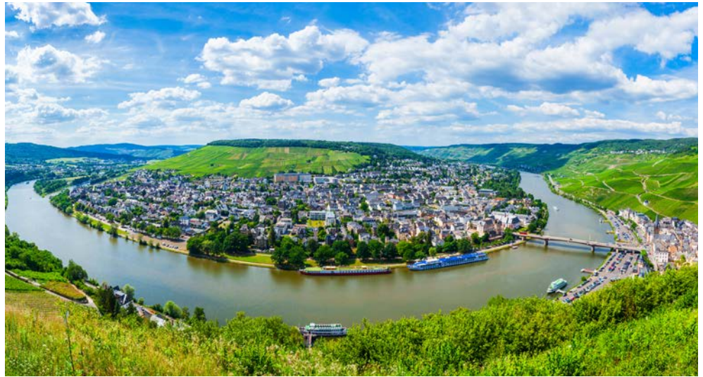
Ihr Ausflugsziel per Mosel-Schiff: Berncastel-Kues