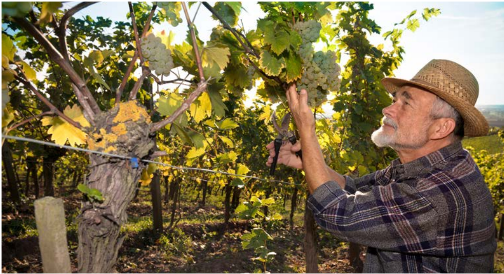
Im Wein liegt die Wahrheit ...

berühmte Gelehrte Nikolaus von Kues geboren wurde. Schlendern Sie über den wunderschönen Markt- platz, vorbei an stolzen Fachwerkhäusern und erstaunlichen Brunnenanlagen. Neben einem inkludierten Stadt- rundgang können Sie auch Zeit zur freien Verfügung nutzen. Den Tag beschließen Sie bei einem ge- meinsamen Abendessen in Ihrem Hotelrestaurant.