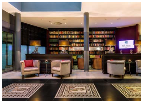
Hotel Park Plaza – Lobby

Mit der Vielfalt einer römischen Therme erwartet Sie der Wellnessbereich Relaxarium sowie der Beautybereich. Sauna, römisches Dampfbad, Laconium, Eisgrotte u.v.m. sorgen ebenso für Entspannung wie Massage- und Kosmetik-Anwendungen (gegen Gebühr). Bauen Sie Stress ab im Fitnessraum und betätigen Sie sich sportlich auf Fahrradergometer, Crosstrainer und Laufband.