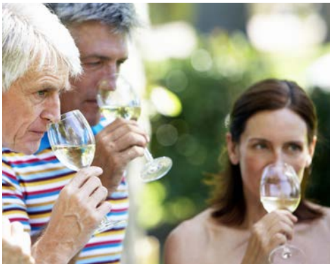
Zu Besuch beim Winzer mit Weinprobe

Was unterscheidet die Rieslingtraube von der Bac- chustraube? Was macht die besondere Heraus- forderung der moseleigenen Steillagen aus? Welche Eigenschaften hat der hiesige Devonschiefer, welche Erziehungsarten gibt es und was hat der Winzer beim An- und Ausbau des Weines zu beachten? „Erlaufen“ Sie sich mit einem Winzer die größte Rieslingsanbau- fläche und das größte Steillagenweinbaugebiet der Welt.