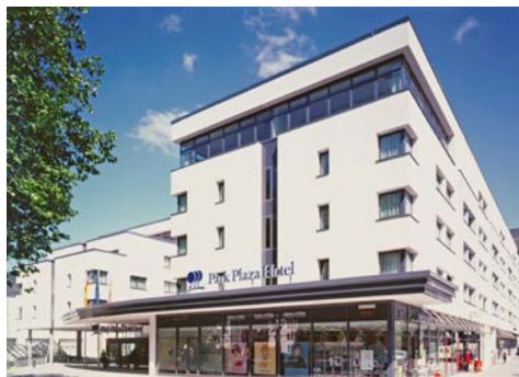
Hotel Park Plaza – Außenansicht