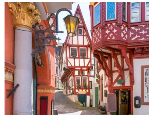
Willkommen in der Fachwerkstadt Berncastel-Kues

Nach dem gestrigen Tag sind Sie in Sachen Trier bestimmt gut bewandert. Vielleicht haben Sie einen Ort, ein Denkmal, ein hübsches Café gesehen, das Sie heute unbedingt auf eigene Faust entdecken möchten. Oder aber Sie unternehmen individuell einen Ausflug in die Umgebung. Ihre Reiseleitung ist Ihnen bei der Tagesplanung sicher gern behilflich.