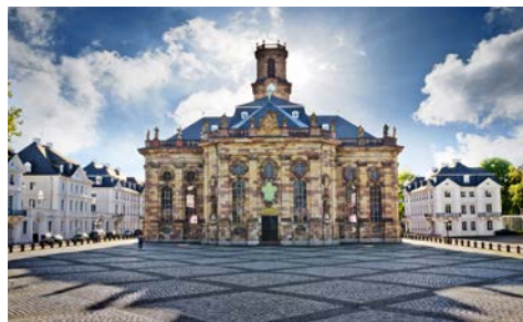
Ludwigsplatz in Saarbrücken

Die Vorteilspreise gelten für ein limitiertes Kontingent. Sie erhalten Ihre Kabinenummer mit den Reiseunterlagen.