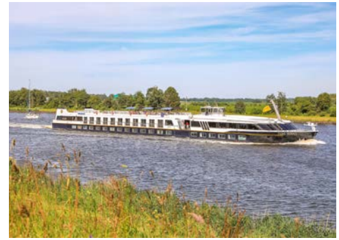
Die SANS SOUCI

Ausführliche Informationen zum Schiff, zum Decksplan sowie zu technischen Hinweisen bei Flussschiffen erhalten Sie im Internet unter der unten angegebenen Adresse.