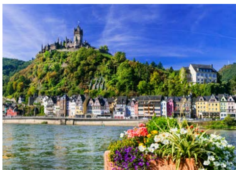
Die Reichsburg thront oberhalb von Cochem

Erleben Sie die unvergleichliche Mosel-Atmosphäre zunächst noch einmal in Bernkastel-Kues – vielleicht bei einem Spaziergang entlang des weitläufigen Moselufers. Anschließend bringt Sie Ihr Schiff weiter nach Cochem, ein verträumtes Städtchen mit verwinkelten Gassen und liebevoll restaurierten Fachwerkhäusern. Lohnenswert ist ein gemütlicher Spaziergang durch das viel besuchte Weinstädtchen. Die zahlreichen gut erhaltenen Reste der historischen Stadtmauer mit ihren alten Befestigungswerken zeugen noch heute von der belebten Vergangenheit.