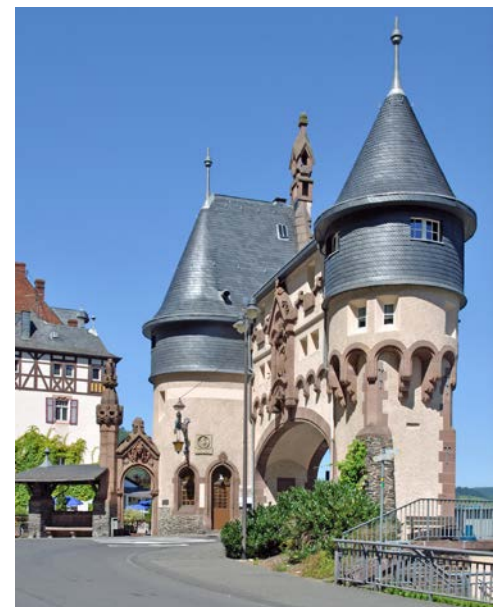
Brückentor in Traben Trarbach

Sie verlassen Rüdesheim und nehmen Kurs auf Alken. Damit haben Sie die liebe Mosel erreicht, die sich kurvenreich und sanft von Weinörtchen zu