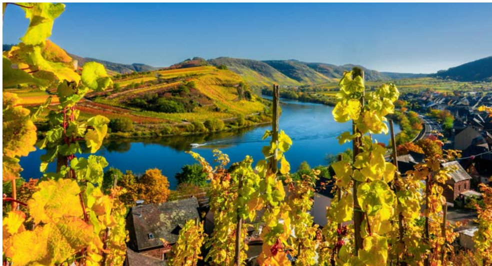
Mosel in goldenem Licht