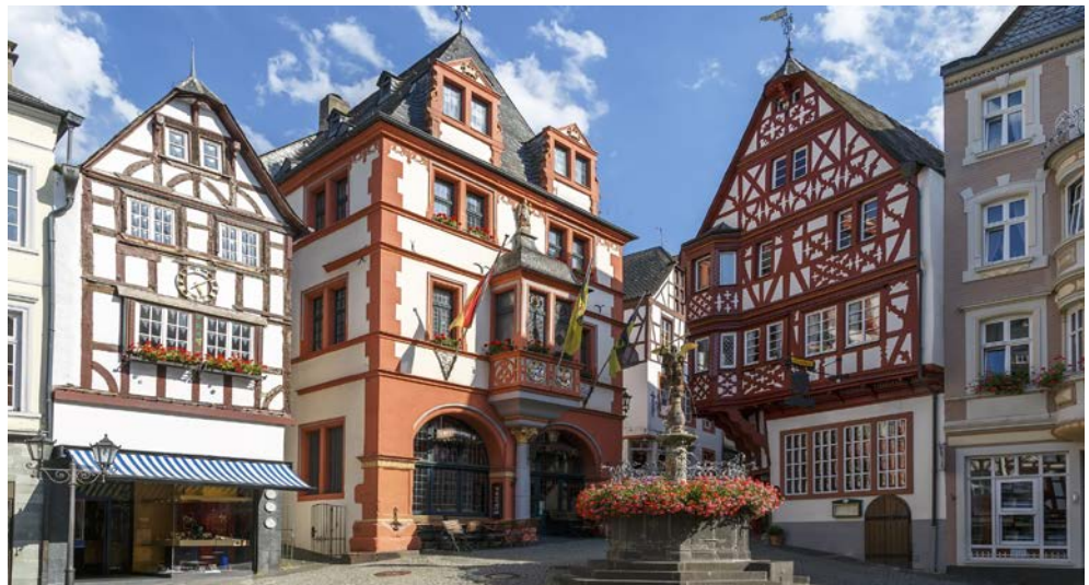
Marktplatz von Bernkastel-Kues