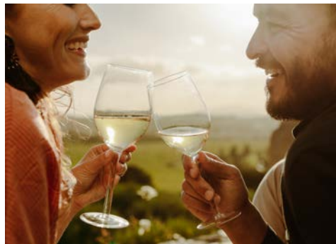
Genießen Sie Ihre Zeit in Rüdesheim

Direkt in einer Moselschleife gelegen besticht Traben Trarbach mit einem wunderschönen Panorama. Über der Stadt thronen die Mauern der 1350 erbauten Grevenburg von der nach 1734 nur noch Ruinen übrig geblieben sind. Ihre Weiterfahrt führt Sie nach Bernkastel-Kues, ein wahres Kleinod an der Mosel. Klein und fein, trägt der Ort trotzdem einen so großen Beinamen wie „Internationale Stadt der Rebe und des Weines“. Nutzen Sie die Gelegenheit und probieren Sie hervorragende Weine direkt vor Ort beim Winzer! Sie finden hier auch ein Weinemuseum. Doch Bernkastel hat noch mehr zu bieten: Sie besuchen eine Stadt, in der schon die Römer ihre Spuren hinterließen. Schlendern Sie über den wunderschönen Marktplatz, vorbei an stolzen Fachwerk-Häusern, und besichtigen Sie das Geburtshaus von Nikolaus von Kues.