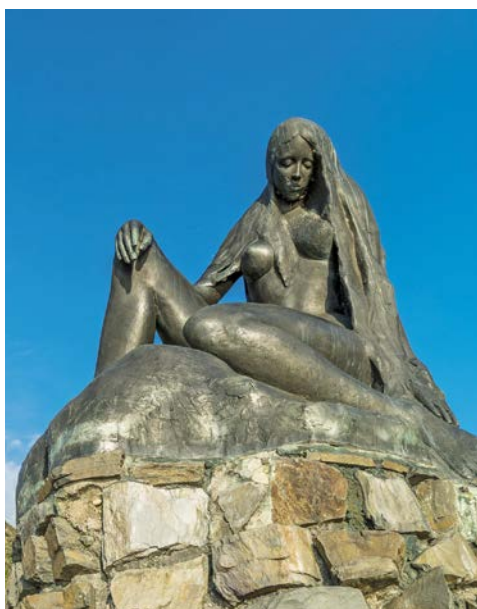
Lassen Sie sich von der Loreley betören

Heute endet Ihre erlebnisreiche Flussreise auf Rhein und Mosel. Ausschiffung nach dem Frühstück.