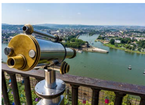
Die Basilika St. Kastor in Koblenz

Koblenz gehört zu den ältesten Städten Deutschlands. Lernen Sie die Zeugnisse der über 2.000-jährigen Geschichte der Stadt kennen. Entdecken Sie Schlösser, ehemalige Adelshöfe und herrschaftliche Bürgerhäuser, enge Gassen und romantische Winkel.