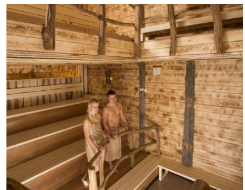
Pure Entspannung in der Sauna nach einer Radtour

mit Jahrzehnte alten, groben Rundhölzern, phantasievollen Wandbemalungen und einer mystischen Feuerstelle gebaut worden. Namenspatin sind die Elfen aus der Zeit der Germanen, die damals Alfen hießen. Beim Wellnessangebot gibt es neben klassischen Anwendungen auch „germanische Spezialitäten“, wie die germanische Goldmassage (gegen Gebühr).