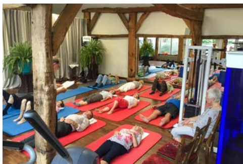
Kurs Autogenes Training

Im Anschluss an eine letzte Radtour fahren Sie am späten Nachmittag gut erholt und mit viel Schwung wieder nach Hause.