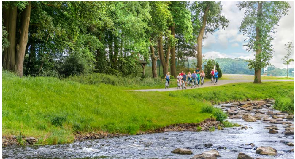
Rund um den Alfsee laden gut ausgebaute Radwege zum Entdecken und Genießen ein

Und das Beste: Für diesen Radurlaub „auf Rezept“ brauchen Sie selbstverständlich kein ärztliches Rezept. Sie treten täglich kräftig in die Pedale und nehmen automatisch an zwei zertifizierten Präventionskursen teil. Durch die Teilnahme daran erhalten Sie von Ihrer Krankenkasse einen Zuschuss von mindestens € 75,- pro Kurs. So bringt Sie diese Reise nicht nur in Schwung, sondern schont auch Ihr Portemonnaie. Wir wünschen Ihnen ein gesundes Vergnügen!