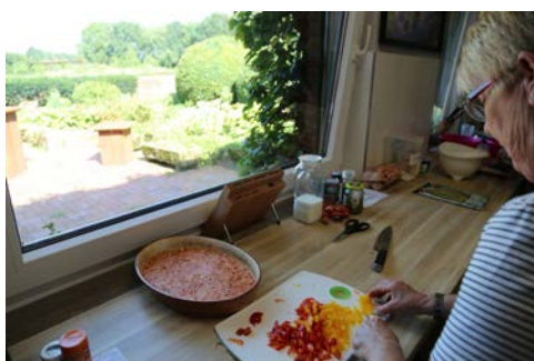
Kurs Gesunde Ernährung auf idyllischen Höfen

Sie unternehmen jeden Tag eine geführte Radtour durch das schöne Osnabrücker Land