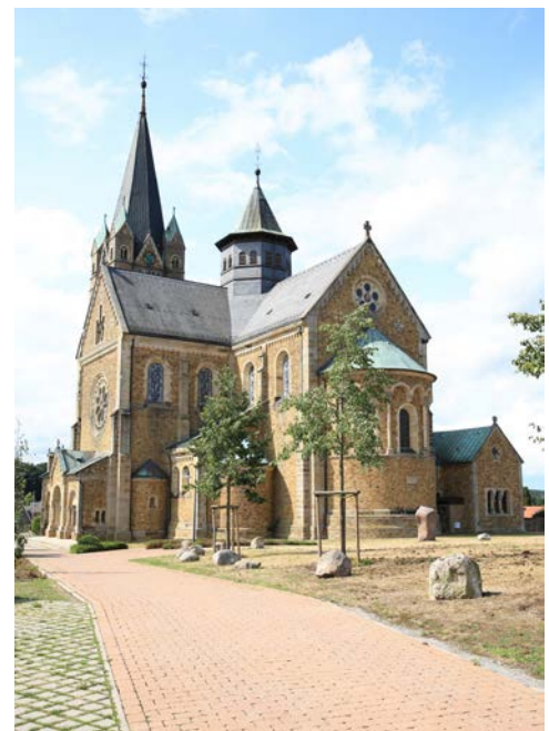
Nikolaikirche in Ankum

Verschiedene Saunen und ein großes Schwimmbad laden nach den Radtouren zum Erholen ein. Ihr Hotel verfügt über eine direkte Anbindung zum Alfen Saunaland. Diese Wellness-Welt mit verschiedenen Saunen, Dampfbad, Aufgüssen, Salzgrotte, Fitnessstudio, Kosmetik und Massage ist der Trendsetter in Sachen Erholung. In Anlehnung an die vergangene geheimnisvolle Welt der Germanen ist die Anlage