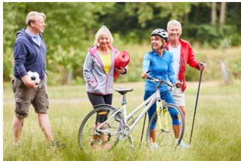
Mit netten Mitreisenden unterwegs

Individuelle Anreise von Bremen nach Rieste im Osnabrücker Land. In Ihrem Ringhotel Alfsee Piazza treffen Sie sich um 14.00 Uhr mit Ihrem Reiseleiter zur ersten Radtour in die nähere Umgebung. Am Abend genießen Sie ein köstliches 2-Gänge-Menü im Hotelrestaurant.