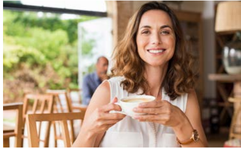
Genuss auf Italienisch

einen kleinen Spaziergang durch die wunderschöne Ortschaft zu machen. Im Hotel angekommen schließt das Abendessen Ihren Tag ab. (ca. 270 km)