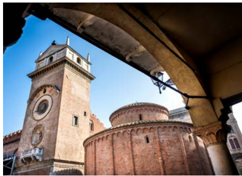
Imposant – Kirche San Lorenzo in Mantua

Der heutige Tag erwartet Sie mit einem Ausflug nach Mantua. Lernen Sie die Stadt bei einer Stadtführung kennen. Anschließend haben Sie Zeit, die gewonnenen Eindrücke zu verarbeiten oder um einen kleinen Stadtbummel zu unternehmen. Danach führt Sie der Ausflug nach Isola della Scala, wo Sie eine Besichtigung einer Reismühle auf dem Programm steht. Highlight hierbei wird die Verkostung eines typischen Risottos sein. Falls es die verbleibende Zeit erlaubt, halten wir auf der Rückkehr ins Hotel im Ort Valeggio sul Mincio an, wo Sie die Möglichkeit haben