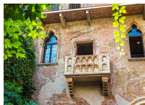
Romeo und Julias Balkon in Verona

Dieser Ausflug führt Sie heute an den Gardasee. Hierbei machen Sie Stops in verschiedenen charakteristischen Dörfern, um einen ersten Eindruck der italienischen Lebensweise zu erhalten. Dazu gehören unter anderem Malcesine und Garda. Anschließend steht Ihnen etwas Zeit zur Verfügung, um bei einer Mittagspause (nicht im Preis inkludiert) die bisherigen Eindrücke des Ausfluges Revue passieren zu lassen. Am Nachmittag erwartet Sie eine Schiffsfahrt von Garda bis Sirmione, wo Sie ein kleiner Spaziergang mit der Reiseleitung durch den malerischen Ort führt. Anschließend Rückfahrt und Abendessen im Hotel. (ca. 170 km)