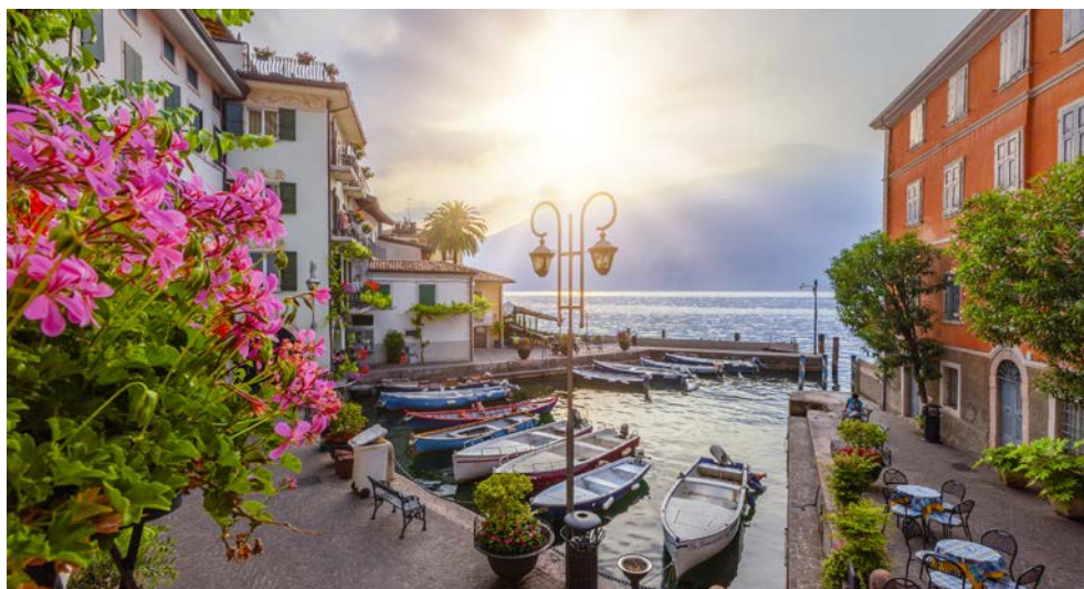
Limone sul Garda

Eine beinahe schon mediterrane Landschaft, entspannte Spaziergänge an Seepromenaden, durch Arkaden und üppige Parks, einmalige kulturelle Schätze: Es gibt viele Gründe für eine Reise an den Lago di Garda. Der Gardasee übt eine gewaltige Faszination aus. Südlich der Alpen verlieren die atlantischen Tiefausläufer ihre Wirkung und man taucht ein in ein mediterranes Klima. Mit den schneebedeckten Hochalpen im Hintergrund öffnet sich eine subtropische Park- und Gartenlandschaft. Hinzu kommt der Reiz einer gewachsenen Kulturlandschaft mit alten Städten und Dörfern, überragt von romanischen Kirchen, den großen Jugendstilvillen des ausgehenden 19. Jahrhunderts und der barocken Pracht der Isola del Garda.