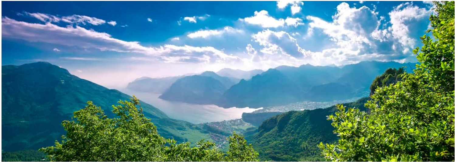
Blick auf den Gardasee