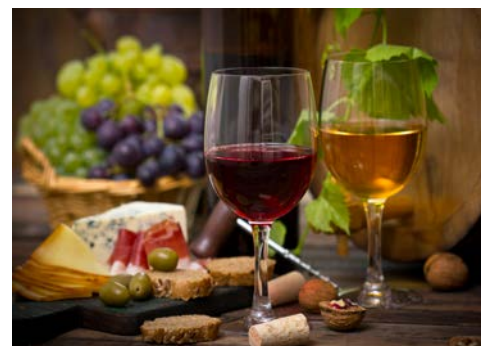
Genießen Sie Ihre Weinprobe

Der heutige Ausflug führt Sie in die romantische Stadt Verona. Die ersten Eindrücke der Stadt, in der sich Romeo und Julia ineinander verliebt haben sollen, erhalten Sie durch eine Stadtführung. Anschließend haben Sie Zeit, Verona auf eigene Faust zu erkunden, einen kleinen Snack zu sich zu nehmen oder reizvolle Erinnerungen zu sammeln. Am Nachmittag führt Sie Ihr Tagesausflug weiter zu einem Weinkeller im Valpolicellatal. Hier erwartet Sie ein Rundgang, der mit einer Weinverkostung und einem kleinen Imbiss abgerundet wird. Anschließend Rückfahrt zum Hotel und Abendessen. (ca. 200 km)