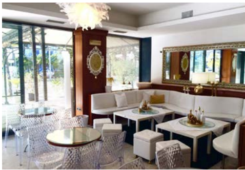
Hotel La Perla – Außenansicht und Lounge