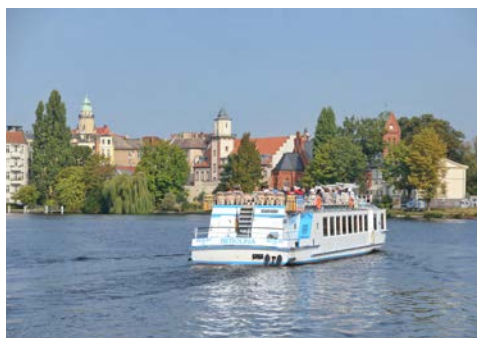
Schiffsfahrt über den Müggelsee

Sie reisen individuell nach Berlin und beziehen ab 15 Uhr Ihre Zimmer im Pentahotel in Köpenick. Um 17.30 Uhr begrüßt Sie Ihre Berliner Gästeführerin bei einem Glas Sekt und gemeinsam fahren Sie in ein Restaurant direkt am einzigartigen Spreetunnel in Friedrichshagen. Hier genießen Sie beim Abendessen einen unvergesslichen Blick über Spree, Müggelsee und Müggelberge.