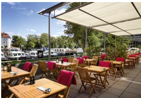
Die Terrasse Ihres Hotels