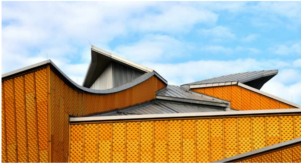
Die Berliner Philharmonie