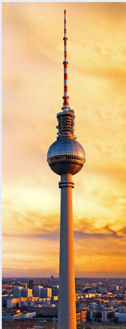
Der Berliner Fernsehturm

Um 16.30 Uhr werden Sie wieder abholt und unter dem futuristischen Dach des SonyCenters am Potsdamer Platz wird Ihnen ein frühes Abendessen serviert, bevor Sie die benachbarte Berliner Philharmonie besuchen. Nach über vier Jahrzehnten Weltkarriere feiert Anne-Sophie Mutter im Juni ihren 60. Geburtstag. Wenngleich sie mit den berühmtesten Orchestern und Dirigenten auftritt, klingt ihr Lebensziel ganz bescheiden: „Die Seele verströmen“. Sie möchte etwas weitergeben und bewirken - mit ihrer Musik, aber auch durch die Nachwuchsförderung. Mit ihrem Solisten-Ensemble wird Anne-Sophie Mutter Veracini (Konzert für Violine, Streicher und Basso continuo D-Dur), Bach (Konzert für Violine, Streicher und Basso continuo Nr. 1 a-moll BWV 1041) und Brandenburgisches Konzert Nr. 3 G-Dur BWV 1048), Bologne C. de Saint-George (Konzert für Violine und Streicher Nr. 2 A-Dur op. 5) und „Nonet“ von Previn zum Besten geben, welches eigens für sie komponiert wurde.