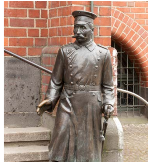
Der Hauptmann von Köpenick vor dem Rathaus