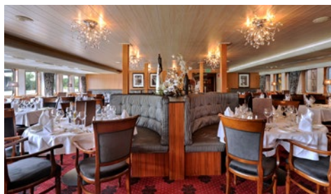
Gepflegte Gastlichkeit im Restaurant