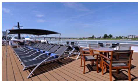
Auf dem Sonnendeck

Kleidungsempfehlung: Tagsüber sportlich-leger und bequem. Zum Abendessen ist gepflegte Kleidung erwünscht, zum Kapitänsdinner ist sportlich-elegante Garderobe angebracht.