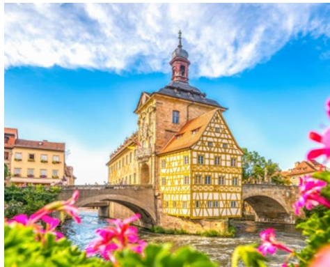
Bamberg lohnt mehr als einen Blick

Anreise wie gebucht. In der zweitgrößten Stadt Bayerns, die am Ufer der Pegnitz und am Rhein-Main-Donaukanal gelegen ist, erwartet Sie die CRUCEVITA bereits zur Einschiffung.