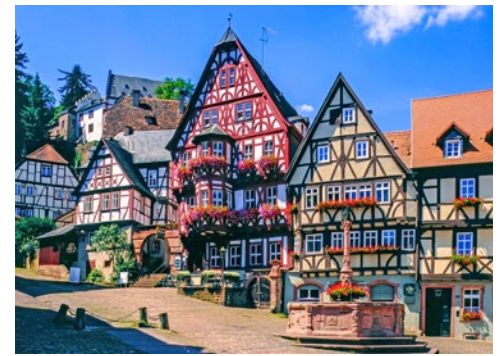
Marktplatz von Miltenberg

umsäumt. Von hier blickt man hinab auf die alte Universitätsstadt mit ihren Kuppeln, Türmen und Brücken.