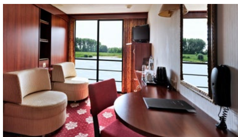
Kabinenbeispiel mit frz. Balkon

Optisch ähnelt die CRUCEVITA einer Yacht. Sie verfügt zwar über einen luxuriösen Look, versprüht dabei aber ein gemütliches Flair. Erbaut wurde das Schiff 1995, im Jahr 2019 erhielt es eine umfassende Renovierung. Den maximal 110 Passagieren stehen zwei Kabinendecks und ein Sonnendeck beim Aufenthalt auf dem Schiff zur Verfügung. Hier lässt sich das einmalige Flair auf dem Fluss erleben.