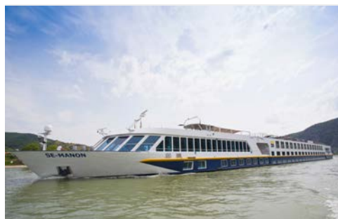
Ihre schwimmende Begleiterin – die SE-MANON