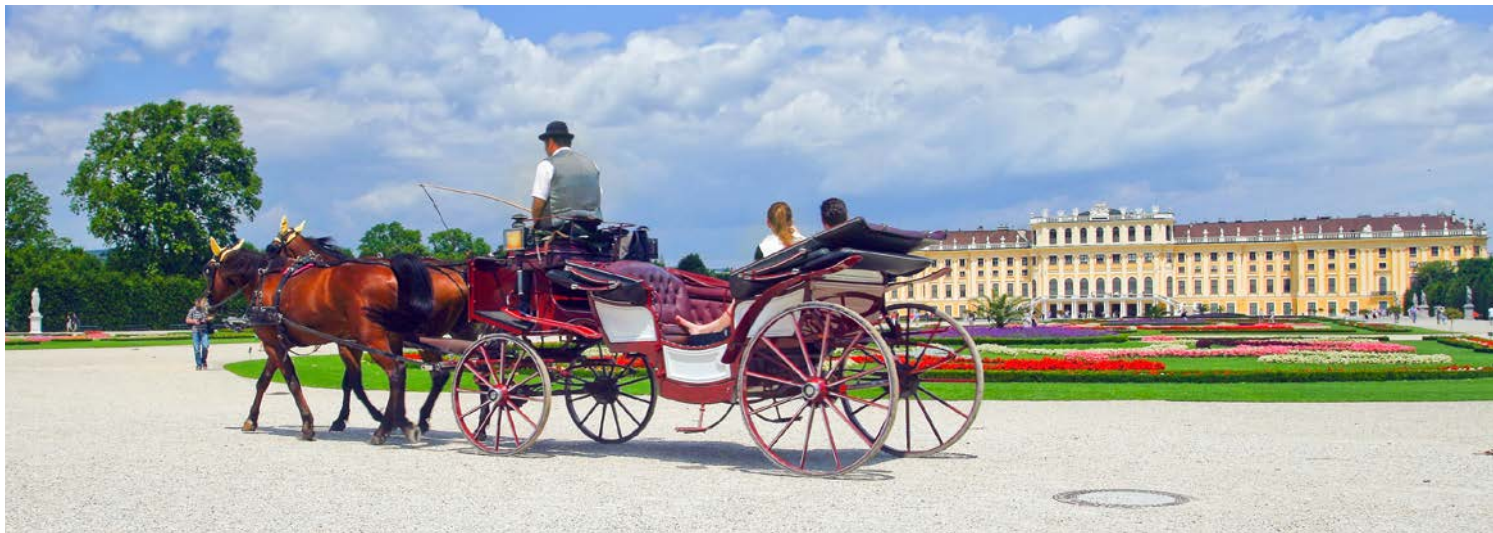
Schloss Schönbrunn in Wien

sanft hügelige Landschaft der Ungarischen Wachau bis nach Esztergom, wo die prachtvolle Basilika hoch über dem Burgviertel in den Himmel ragt. Zwei Fahrradrouten stehen zur Wahl: Die längere Variante beinhaltet einen Abstecher auf die Szentendre-Insel und in die Barockstadt Vác, die kürzere Tour führt direkt nach Esztergom. Nachts Weiterfahrt per Schiff nach Wien.