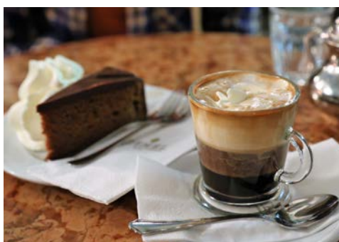
Nach ein paar Radtouren darf man sich auch was gönnen

Die sanfte Hügellandschaft mit verträumten Dörfern, Weinterrassen, Burgen, Klöstern und Ruinen wird Sie verzaubern. Der blaue Turm der Stiftskirche von Dürnstein ist ein Wahrzeichen der Wachau. Genießen Sie einen letzten Blick auf das imposante Stift Melk, einer der bedeutendsten Barockbauten Österreichs, bevor Sie in Pöchlarn wieder an Bord gehen und Richtung Passau fahren. Zur Weiterfahrt