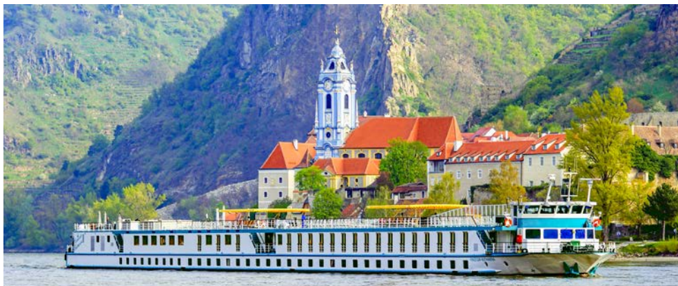
Dürnstein in der Wachau

Inklusive Busfahrt ab/bis Bremen nach Passau und zurück. Hinweis Bustransfer: Bei Nichterreichen der Mindestteilnehmerzahl von 30 Personen, behalten wir uns eine alternative An- und Abreise vor. Bitte beachten Sie, dass es sich um Umsteigeverbindungen handeln kann.