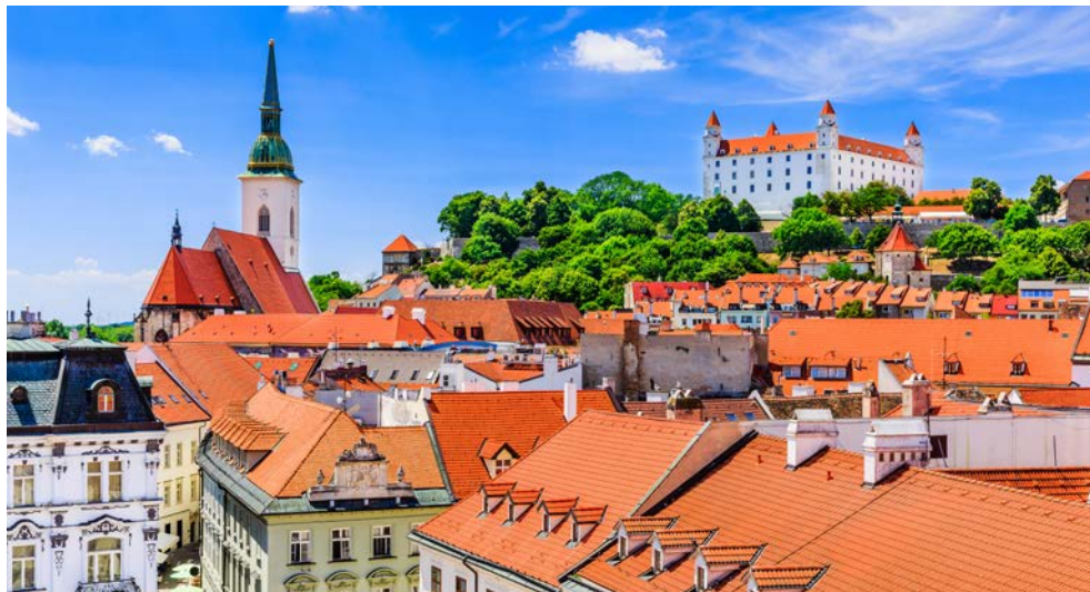
Bratislava mit der Pressburg im Hintergrund