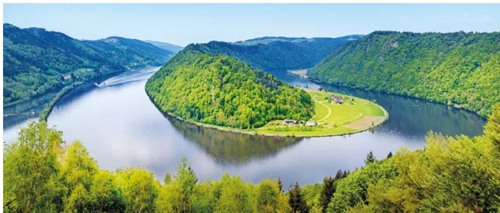
Die Schlögener Schlinge – spektakulär!

Die Radtour durch das Donauknien ist auch ein Ausflug in die Geschichte Ungarns. Vom ehemaligen Königssitz Visegrad radeln Sie durch die malerische,