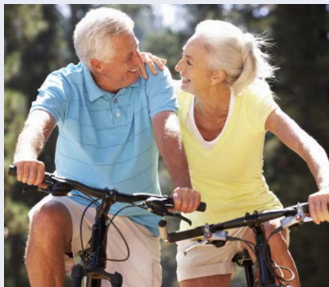
Per Rad und Schiff – die perfekte Reiskombination.