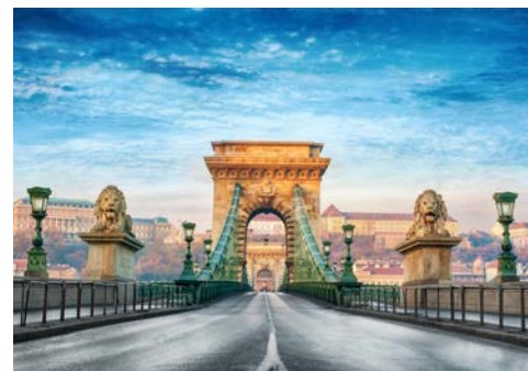
Willkommen in Budapest

Am Morgen erreichen Sie Devin. Entlang des einstigen Eisernen Vorhangs führt Ihr Radweg von der Burgruine Devin zum imposanten Schloss Hof und weiter nach Bratislava. Tipp: Fahrt mit dem Oldtimerzug durch die zauberhafte Altstadt. Genießen Sie von der Pressburg einen herrlichen Rundblick über die Hauptstadt der Slowakei. Nachts fährt Ihr Schiff von Bratislava nach Budapest.