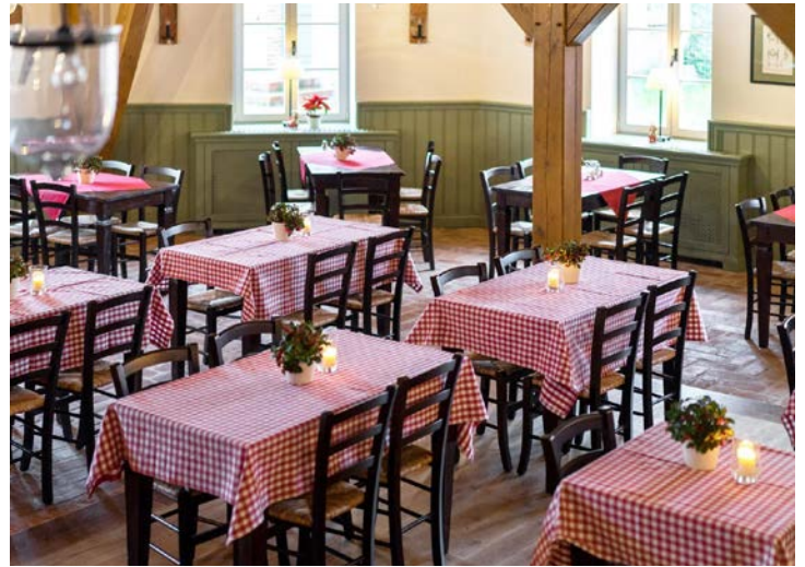
Das Restaurant „Alte Wassermühle“