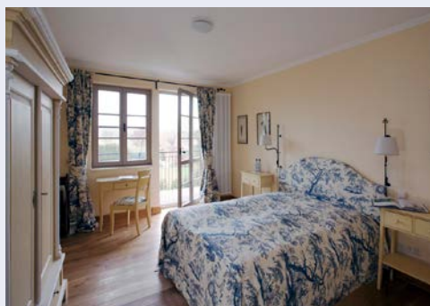
Zimmerbeispiel auf Gut Ulrichshusen

Gönnen Sie sich eine Auszeit vom Alltag und genießen Sie die Tage auf Schloss und Gut Ulrichshusen. Wenn am Nachmittag Kerzenlicht für Glanz und Wärme sorgt und der Duft von warmen Zimtgebäck und Tannenkränzen durch die Räume strömt, dann ist die Stimmung perfekt für festliche Adventstage auf dem Lande. Wer weiß, ob winterliches Schloß- und Gutsgeflüster und weihnachtliche Dekorationen, Ihnen Inspiration für zu Hause mit auf den Weg geben.