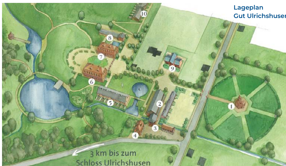
Lageplan Gut Ulrichshusen