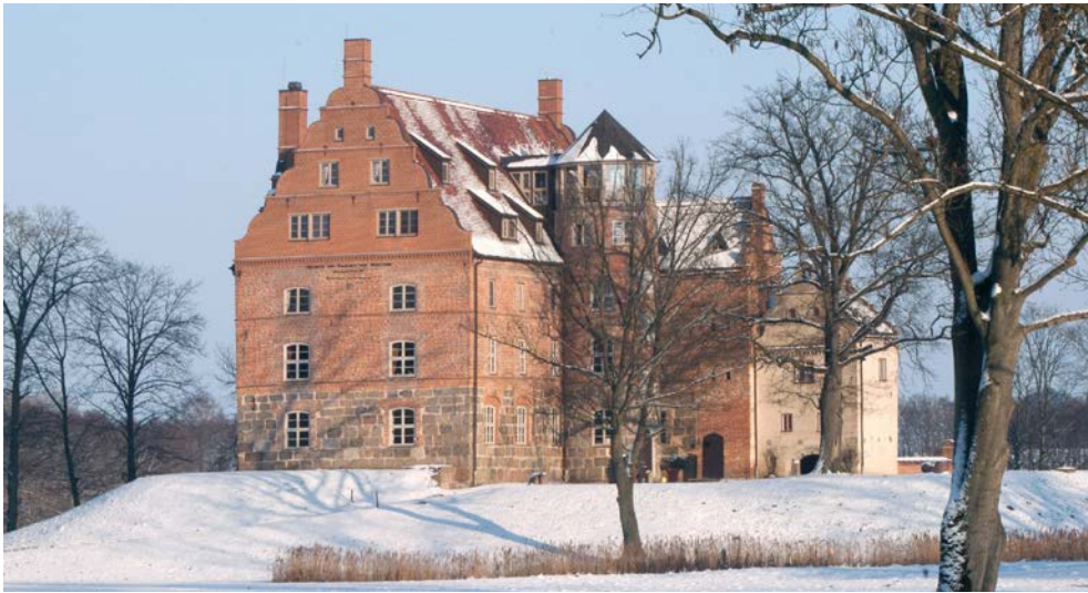
Genießen Sie die romantische Winteratmosphäre