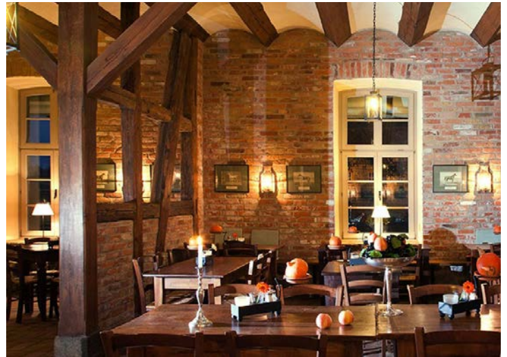
Das Restaurant „Am Burggraben“