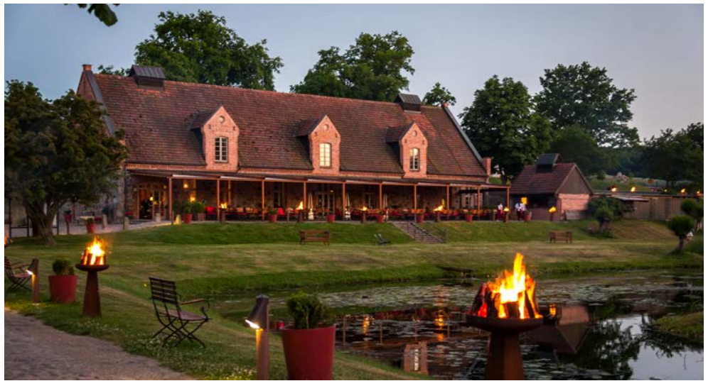
Das Restaurant „Am Burggraben“