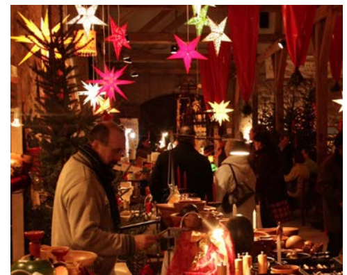
Freuen Sie sich auf den schönen Weihnachtsmarkt