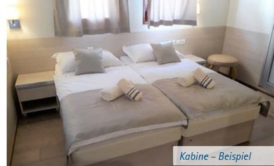
Kabine – Beispiel