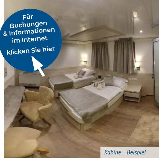
Kabine – Beispiel

Für Buchungen & Informationen im Internet klicken Sie hier