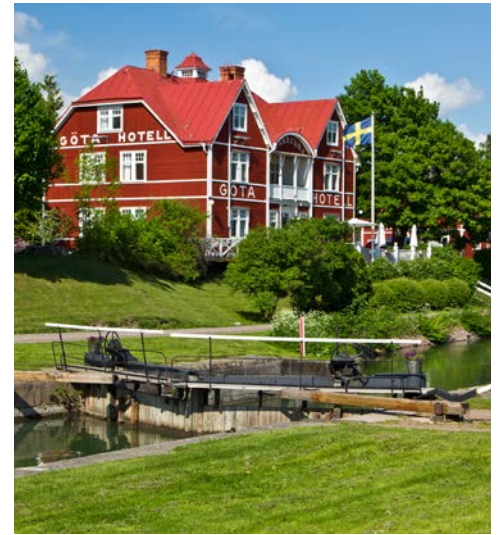
Schwedische Impressionen, Göta Hotell

angelegt. Die Kirche gehört zu den interessantesten in Schweden und beherbergt zahlreiche mittelalterliche Kleinode. Heute wird sie als Pfarrkirche genutzt und kann daher nicht immer besichtigt werden. Wer keine Lust auf Kloster und Kirche hat, der kann auch ein schönes Bad im See Roxen nehmen. In Heda gehen die Ausflügler zurück an Bord und die DIANA passiert das erste Aquädukt der Reise. Sie erreichen das idyllische Kanaldorf Borensberg mit einer von Hand zu bedienenden Schleuse. Vielleicht erspähen Sie das renommierte Göta Hotell von 1908 auf Ihrem Weg zur Schleusentreppe in Borensult mit fünf zusammenhängenden Schleusen und einem gesamten Höhenunterschied von 15,3 m. Motala erlangte durch die 1822 hier angesiedelte Motala Werkstad den Ruf als „Wiege der schwedischen Industrie“. Hier befindet sich auch der Hauptsitz der Firma AB Göta Kanalbolag, die für den Betrieb und den Unterhalt des Kanals verantwortlich ist. Sie besuchen das Motala Motormuseum mit umfassender Sammlung von Autos, und Motorrädern in zeittypischen Szenarien, Radios, Spielzeug und allerlei Kuriositäten.