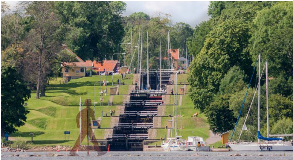
Die Schleusen des Götakanals