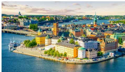
Blick auf Stockholm

Stockholm kann mit einer 750-jährigen Stadtgeschichte aufwarten. Ob Stadhuset, Stadthaus und Wahrzeichen, das königliche Schloss, die Kirche Storkyrkan oder das Vasa Museum – Stockholm hält jede Menge für seine Besucher bereit. Freuen Sie sich am Morgen auf eine informative Stadtrundfahrt. Natürlich statten Sie dann auch dem Kriegsschiff Vasa, gesunken 1628 auf seiner Jungfernfahrt, einen Besuch ab. Der Nachmittag steht Ihnen zur freien Verfügung.