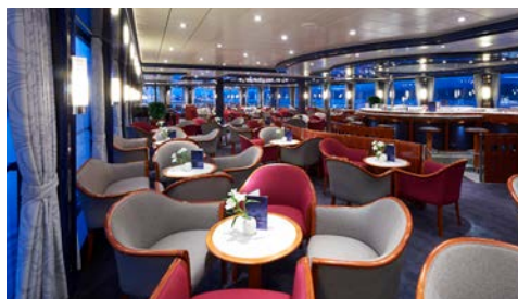
Lounge mit Aussicht

Kleidungsempfehlung: Leger-bequem. Zum Abendessen ist gepflegte Kleidung erwünscht, zum Galadinner ist dezente Eleganz angebracht. Die Bordsprache ist deutsch. Bordwährung: Euro. Als Zahlungsmittel an Bord werden Kreditkarten (Eurocard/Mastercard, VISA) sowie die deutsche EC-Karte (Maestro & V-Pay) akzeptiert.