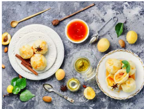
Probieren Sie die leckeren Marillenknoedel der Region

Wenn Sie die Stadtrundfahrt gebucht haben, fahren Sie vom Liegeplatz des Schiffes mit dem Bus zunächst auf der Seite von Buda auf den Burgberg zum ehemaligen königlichen Schloss. Hier haben Sie einen herrlichen Blick über die Donau und den Stadtteil Pest. Sie unternehmen einen gemütlichen Rundgang zur Matthias-Kirche, zur Fischer-Bastei und den reizvollen Gassen der malerischen Altstadt Buda. Von hier geht es über die alte Kettenbrücke hinüber nach Pest, vorbei an der imposanten Stephanskirche aus dem 19. Jahrhundert, durch die sehr breiten Prachtstraßen zum Heldenplatz, der mit seinen monumentalen Bauten 1896 zur ungarischen Tausendjahrfeier errichtet wurde. Auf der Rückfahrt zum Schiff sehen Sie noch eines der bekanntesten Wahrzeichen der Stadt, das neugotische Parlamentsgebäude.