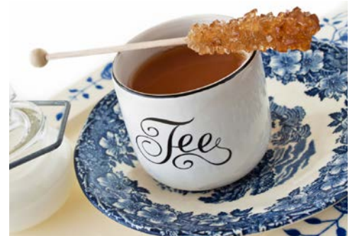
Friesentee – typisch mit Sahne und Kluntjes

pittoresken Hafen bekannt ist. Hier können Sie sich noch mit einem Fischbrötchen stärken – die norddeutsche Spezialität ist nicht aus Friesland wegdenken – bevor Ihre Rundfahrt am Hotel endet.