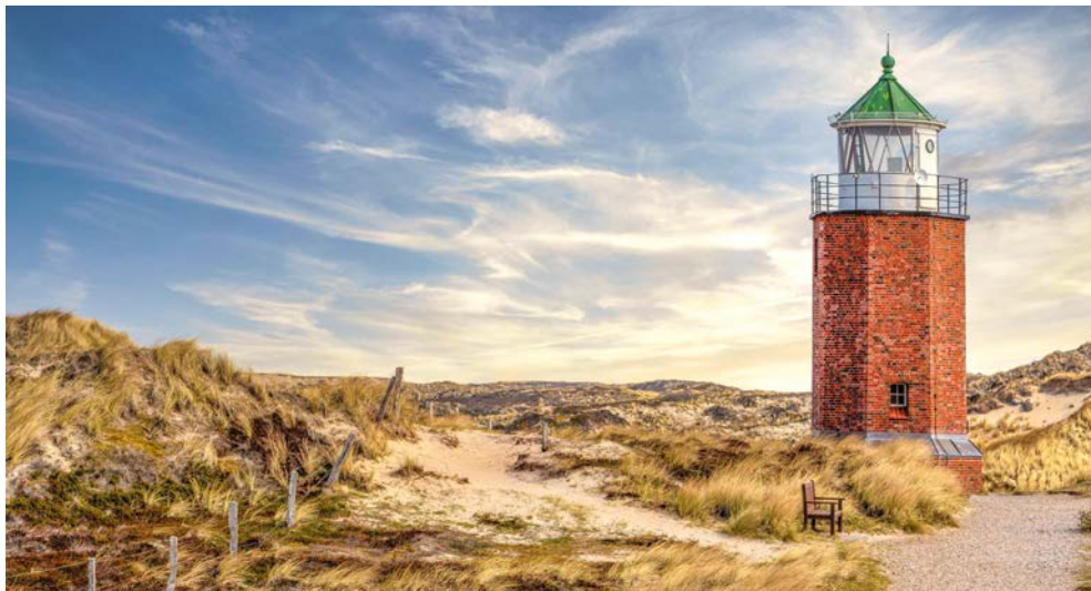
Quermarkenfeuer Rotes Kliff in Kampen

Gemeinsam mit zahlreichen nationalen und internationalen Partnern sind sie daran beteiligt, die komplexen Prozesse im „System Erde“ zu entschlüsseln. Der Planet steckt in einem tiefgreifenden Klimawandel. Die Polargebiete und Meere verändern sich. Gleichzeitig spielen sie eine zentrale Rolle im globalen Klimasystem. Wie entwickelt sich der Planet Erde weiter? Beobachten wir kurzfristige Schwankungen oder langfristige Trends? Schon immer war die Polar- und Meeresforschung eine faszinierende wissenschaftliche Herausforderung. Heute ist sie auch ein Stück Zukunftsforschung.