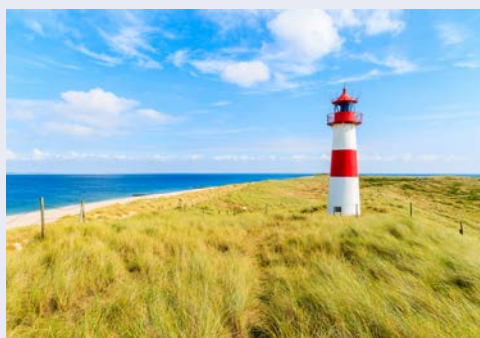
Der Leuchtturm in List