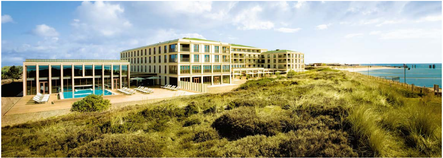
Direkt am Meer, mitten in den Dünen – Ihr A-ROSA Sylt