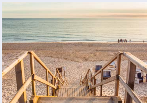
Sandstrand in Rantum