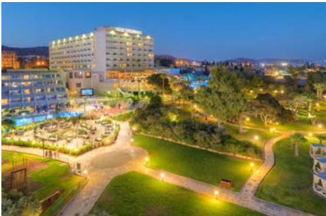
Hotel St. Raphael Resort & Marina

Unmittelbar am feinen Sandstrand gelegen, erfüllt die erst im vergangenen Jahr komplett renovierte Anlage all Ihre Träume. Sämtliche Zimmer verfügen über Balkon oder Terrasse. Zu den Mahlzeiten stehen auf der weitläufigen Anlage mehrere Restaurants zur Auswahl, überdies finden sich auf dem Gelände einige Bars und ein Lobby-Café. Neben zwei Frischwasser-Außenpools lädt ein Spa mit Sauna zum Entspannen ein. Daneben verfügt das Hotel auch über zwei Tennisplätze.