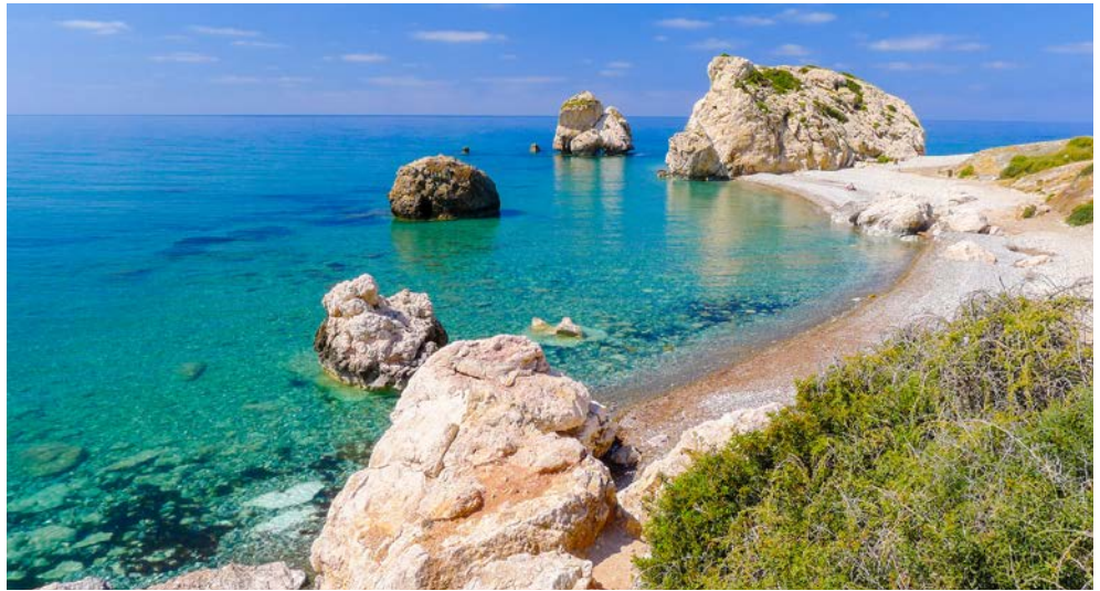
Felsen der Aphrodite

Hier machen die Götter Urlaub! Schon in der griechischen Mythologie wurde die paradisiische Mittelmeerinsel gepriesen. Zypern – das ist südländische Lebensart und eine Sagenwelt voller Mythen und Legenden. Die spannende Historie dieser Insel, die seit 1974 in den türkisch besetzten Teil und die Republik Zypern geteilt ist, lässt sich auf dieser Reise nachvollziehen. Ob antike Zeugnisse der römischen Besatzung, mystische Klöster, die eindrucksvollen Bäder der Aphrodite, lokale Weinanbauregionen, die im türkisch besetzten Teil liegende Stadt Famagusta oder die pulsierende Hauptstadt Nikosia – auf dieser Reise lernen Sie nicht nur die Vielfalt der zypriotischen Kultur kennen, sondern auch und vor allem das Leben und die Menschen auf dieser einzigartigen Insel.