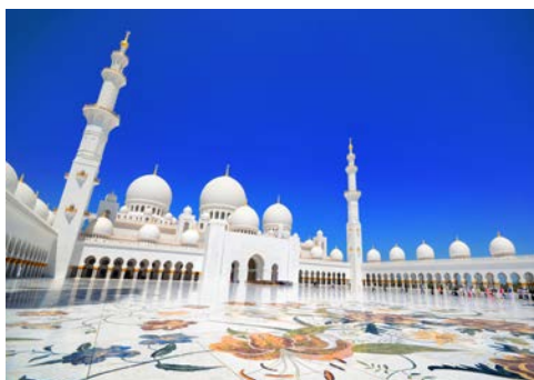
Sheikh Zayed Moschee in Abu Dhabi

Ihr Tagesausflug bringt Sie in das reichste Emirat nach Abu Dhabi. Die gleichnamige Metropole, einst Zentrum der Perlenfischerei, ist heute wirtschaftlicher und politischer Mittelpunkt der Vereinigten Arabischen Emirate. Sie besichtigen die majestätische, wie aus den Märchen aus 1001 Nacht entsprungen, große Sheik Zayed Moschee mit ihren vier bleistiftschlanken Minaretten und ihrer Hauptkuppel mit 32,70 m Durchmesser. Betreten Sie diesen