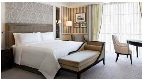
Beispiel – Doppelzimmer Deluxe

Das Luxushotel bietet 234 prunkvoll dekorierte Zimmer, inklusive 52 Suiten, die mit luxuriösen Annehmlichkeiten und dekadentem Stil aufwarten. Alle Hotelgäste genießen persönlichen Butler-Service. Die eleganten Zimmer heißen Gäste mit einer sanften Farbpalette aus perfekt abgestimmten Pastelltönen willkommen. Modernes Mobiliar, ein luxuriöses Kingsize-Bett und ein begehbarer Schrank schaffen ein reizvolles Ambiente.