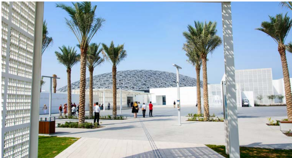
Faszinierend – der Louvre in Abu Dhabi