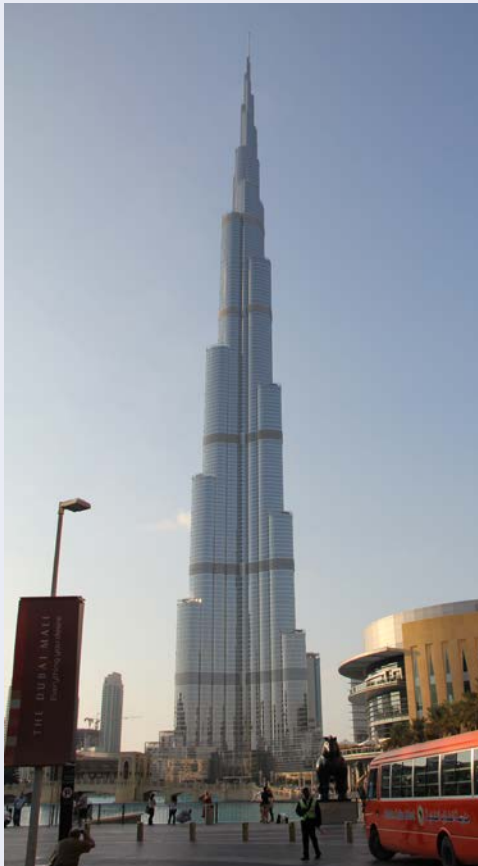
Der Burj Khalifa

Auch der heutige Tag steht ganz im Zeichen der Weltausstellung. Ihr deutschsprachiger Reiseführer wird mit Ihnen verschiedene Landes pavillons aus den Bereichen Mobilität – Chancen – Nachhaltigkeit besuchen. Bei Interesse besteht am Nachmittag die Möglichkeit sich Dubai aus der Vogelperspektive während eines Fluges mit dem Wasserflugzeug anzuschauen. Sie starten vom Flughafen am Creek, überfliegen den höchsten Turm der Welt, vorbei an der