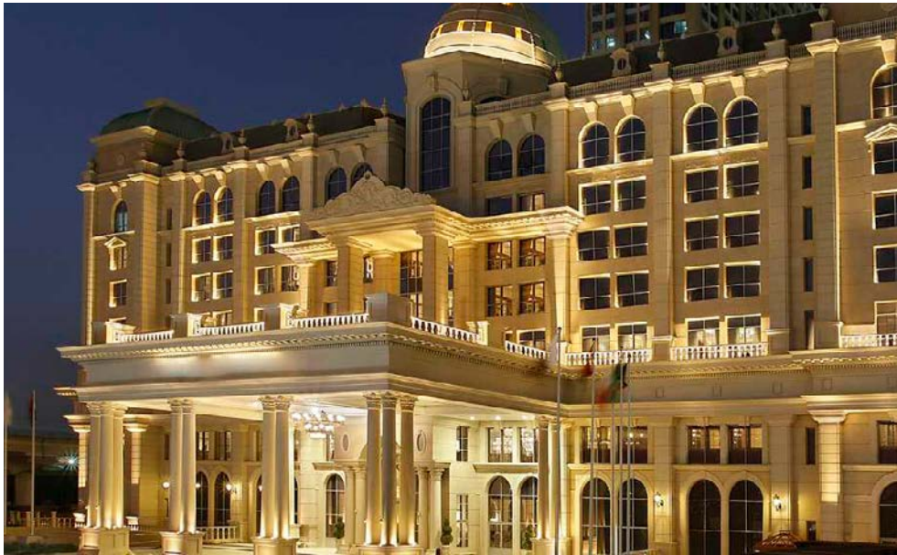
Hotel Hilton al Habtoor