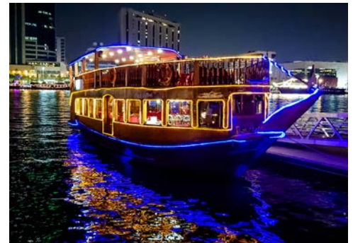
Vielleicht unternehmen Sie eine Dhow-Fahrt?

Die nächsten zwei Tage sind Sie zu Gast auf der Weltausstellung der Superlative. Per Fasttrack betreten Sie den Emirates Pavillon, wo Sie sich von den unglaublichen Technologien überzeugen können, die die Zukunft des Luftreiseverkehrs verändern werden. Desweiteren besuchen Sie mit Ihrem deutschsprachigen Reiseführer verschiedene Landes pavillons aus den Bereichen Mobilität – Chancen – Nachhaltigkeit, wie den Deutschen Pavillon. Zum Ausklang dieses eindrucksvollen Tages haben Sie die Möglichkeit an einer abendlichen Dhow-Fahrt in Dubai-Marina mit Abendessen, vorbei an den glitzernden Wolkenkratzen, teilzunehmen.