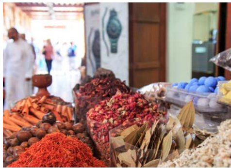
Auch das ist Dubai – Im Gewürz-Soukh