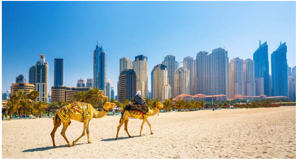
Im Übermorgenland werden Traditionen weiterhin gepflegt

Seit 170 Jahren bieten die Weltausstellungen eine Plattform, um die bedeutendsten Innovationen zu präsentieren, die die Welt, in der wir heute leben, geprägt haben. Kommen Sie mit auf die Weltausstellung der Superlative nach Dubai. Höher, größer, schneller oder doch kompakter, ruhiger, leiser – was wird die Zukunft verbinden? Erleben Sie die „Zeitmaschine“ des Emirates Pavillons und entdecken Sie zukunftsorientierte Technologien im Pavillon der Vereinigten Emirate. Schreiten Sie durch den futuristisch anmutenden, lichtdurchfluteten Japanischen Pavillon und entdecken Sie in den großen Themenpavillons, wie aus Innovation, wissenschaftlichem und technischem Fortschritt Wunschdenken in gelebte Realität umgesetzt werden kann. Lernen Sie aber auch das Dubai der Gegenwart kennen, mit dem höchsten Turm der Welt, den 800 m hohen Burj Khalifa, der „Palme“ und Dubai Marina. Im Emirat Abu Dhabi wird Sie die majestätisch wirkende Sheik Zayed Moschee und der Louvre in Erstaunen versetzen.