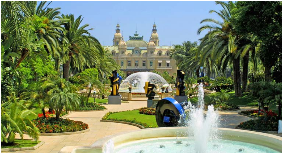
Das berühmte Kasino von Monte Carlo