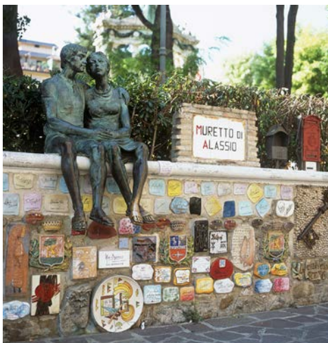
Wahrzeichen Alassios – Il Muretto

Im Rahmen dieses wunderbaren Ausflugs fahren Sie am Morgen ins Fürstentum Monaco, wo Sie ein erster Stopp zum Botanischen Garten bringt (Eintritt nicht inklusive). Weiter geht es in die herrliche Altstadt. Sie besichtigen die Kathedrale – hier befinden sich auch die Gräber der Fürstenfamilie. Anschließend gelangen Sie zum großen Platz vor dem fürstlichen Palast. Ein sehenswertes Schauspiel ist auch die Wachablösung, die jeden Tag um 11.55 Uhr stattfindet. Weitere Stationen Ihrer Rundfahrt sind das „Hotel de Paris“, „Café de Paris“ und das Kasino (Eintritt nicht inklusive). Die Rückfahrt führt über die wunderschöne Panoramastraße, welche hoch über Monaco gelegen ist, zurück in Ihr Hotel.