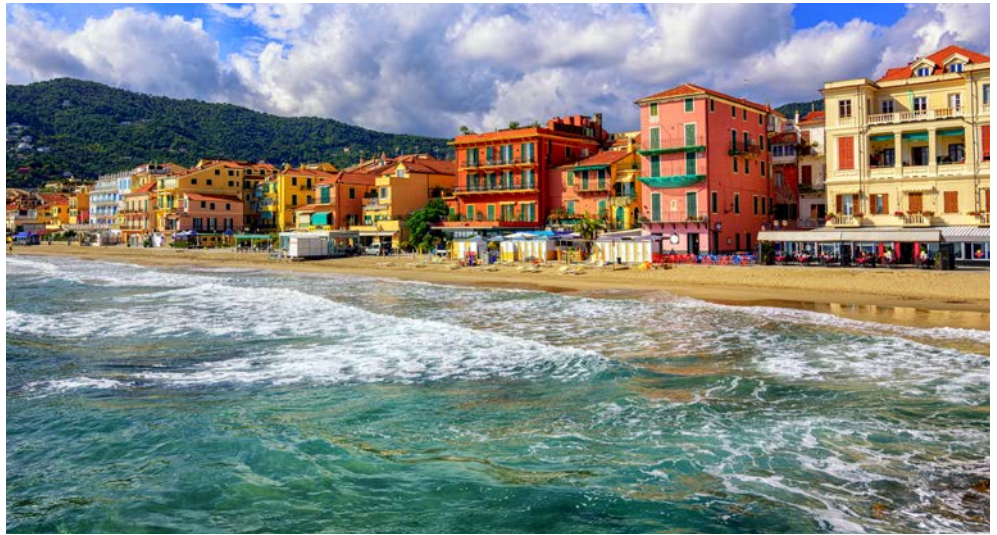
Ihr bezaubernder Urlaubsort Alassio

Liebe Leser, Verführerisch und von einem milden, ausgeglichenen Klima geprägt, präsentiert sich die Küstenregion Liguriens, welche liebevoll Blumenriviera genannt wird. Auch der legendäre Küstenstreifen an der Côte d'Azur ist nach wie vor eines der beliebtesten Reiseziele. Das prächtige Licht- und Farbenspiel im Spätsommer spiegelt die reizvolle Vielfalt der begnadeten Region wider. Mondäne Küstenstädte wie Nizza, das zauberhafte Fürstentum Monaco sowie malerische kleine Badeorte werden Sie begeistern. Weitere Ausflüge führen Sie in das einmalige Genua oder nach San Remo, durch Weinanbaugebiete und in pittoreske Bergdörfer. Genießen Sie die herrliche Landschaft der italienischen und französischen Riviera und lassen Sie sich von Kunst, Kultur und Lebensstil der Mittelmeerregion verzaubern.