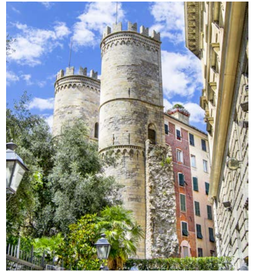
Porta Soprana in Genua