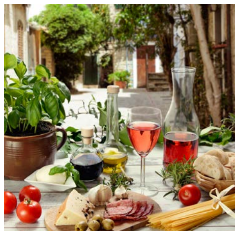
Die ligurische Küche ist ein Genuss

Nach dem Frühstück fahren Sie zurück nach Frankreich. Im Anschluss Flug von Nizza nach Bremen. Anschließend Taxi-service (falls gebucht) nach Hause.