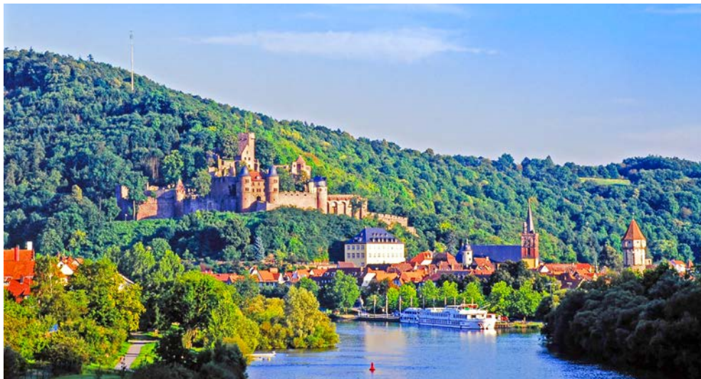
Wertheim lohnt mehr als einen Blick