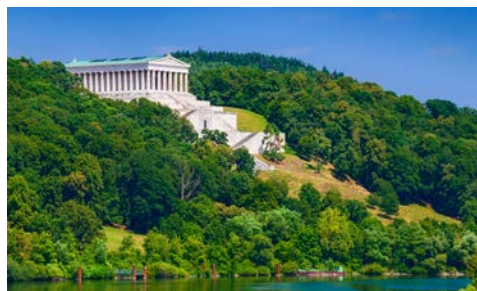
Walhalla bei Donaustauf

In der Nacht hat Ihr Schiff Regensburg erreicht. Nach dem Frühstück erwartet Sie ein geführter Rundgang durch die einstige Freie Reichsstadt. Regensburg wird durch ein mittelalterliches Stadtbild geprägt und ist gleichzeitig auch eine lebendige Metropole mit regem Kulturleben und leicht südländischem Flair. Ein Stadtführer wird Ihnen die wichtigsten Sehenswürdigkeiten, wie z. B. die Schottenkirche, den Haidplatz, das Alte Rathaus, die Steinerne Brücke und den Dom, zeigen. Danach besuchen Sie die Walhalla bei Donaustauf, die dem Parthenon-Tempel der Athener