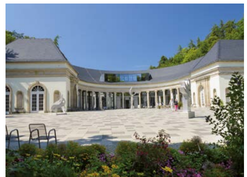
Die Wandelhalle im Kurpark