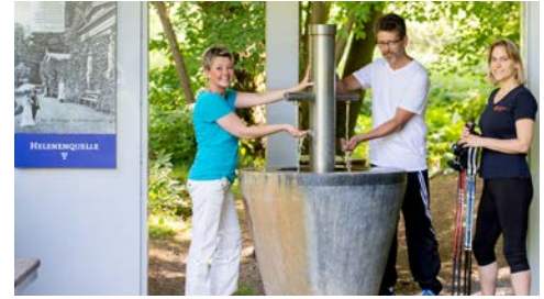
Gesundheitszentrum Helenenquelle - Willkommen!