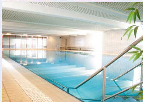
Tun Sie sich etwas Gutes