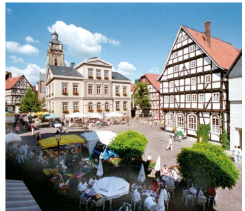
Marktplatz in Bad Wildungen