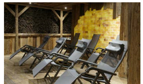
Gesunde Salzluft im hoteleigenen Gradierwerk