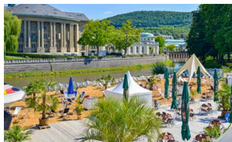
Der Stadtstrand an der Saale

Wie aus einem Kinderbuch entsprungen, wirkt das niedliche, kleine, grün-gelbe Kurbähnle, auch liebevoll Geckobahn genannt, womit Sie bequem die Stadt erkunden können. Die Strecke zwischen Innenstadt und Tierpark Klaushof wurde zunächst mit einem VW Bulli abgedeckt, heute tourt bereits die dritte Generation der beliebten Kleinbahn durch die Straßen Bad Kissingens.